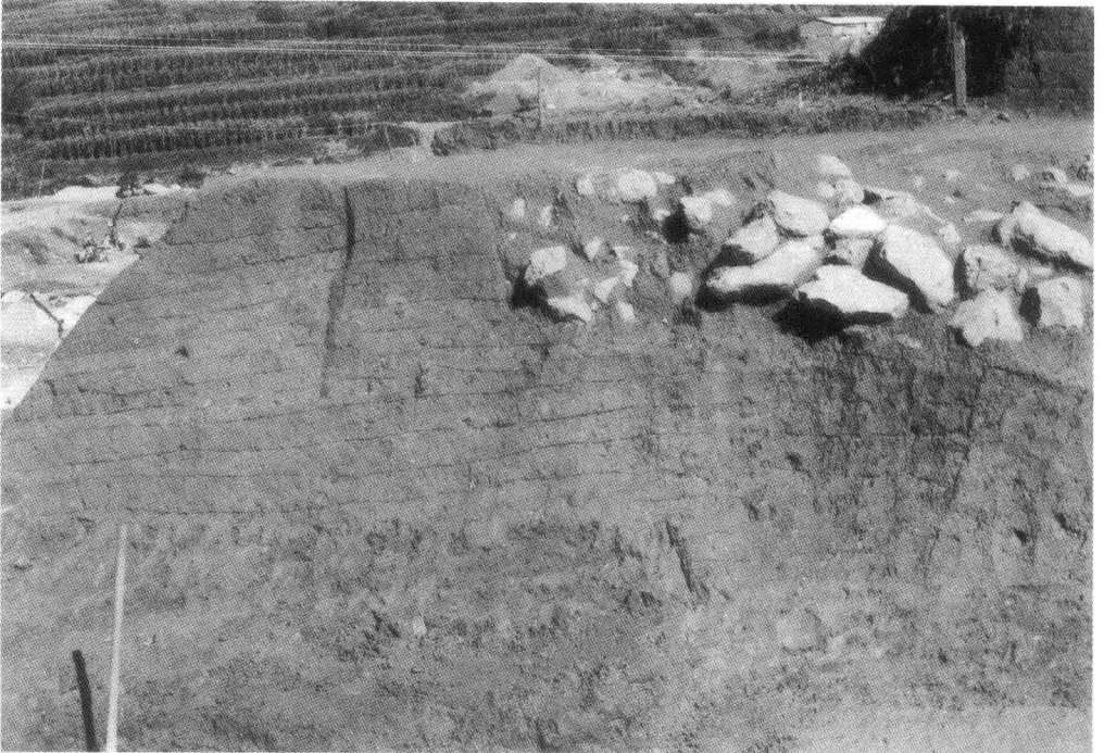
大理龙口城遗址(南诏、大理国)