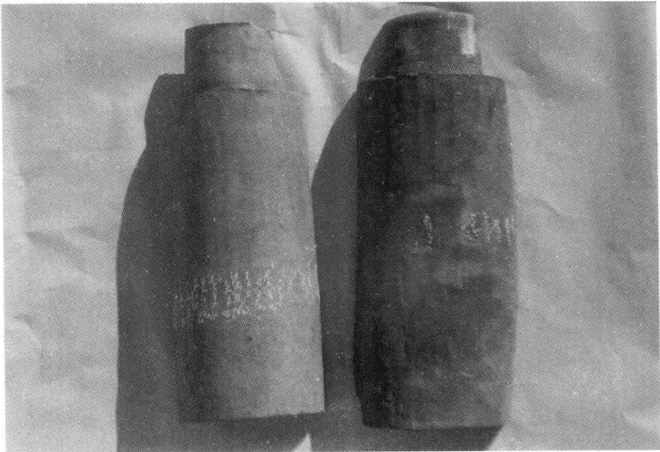
大理葱园村古建筑遗址出土有字筒瓦(大理国)