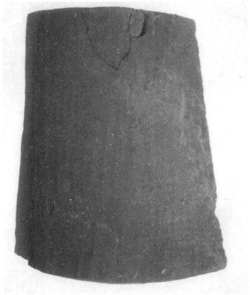
大理阳苴咩城遗址出土有字板瓦(南诏、大理国)