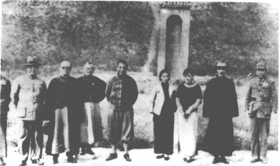
1934年10月21日，张学良陪蒋介石游茂陵。右起：杨虎城、蒋介石、宋美龄、傅学文、张学良、邵力子、杨永泰