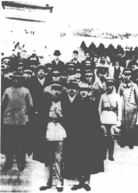
张学良参加孙中山 雕像揭幕与蒋介石等 合影