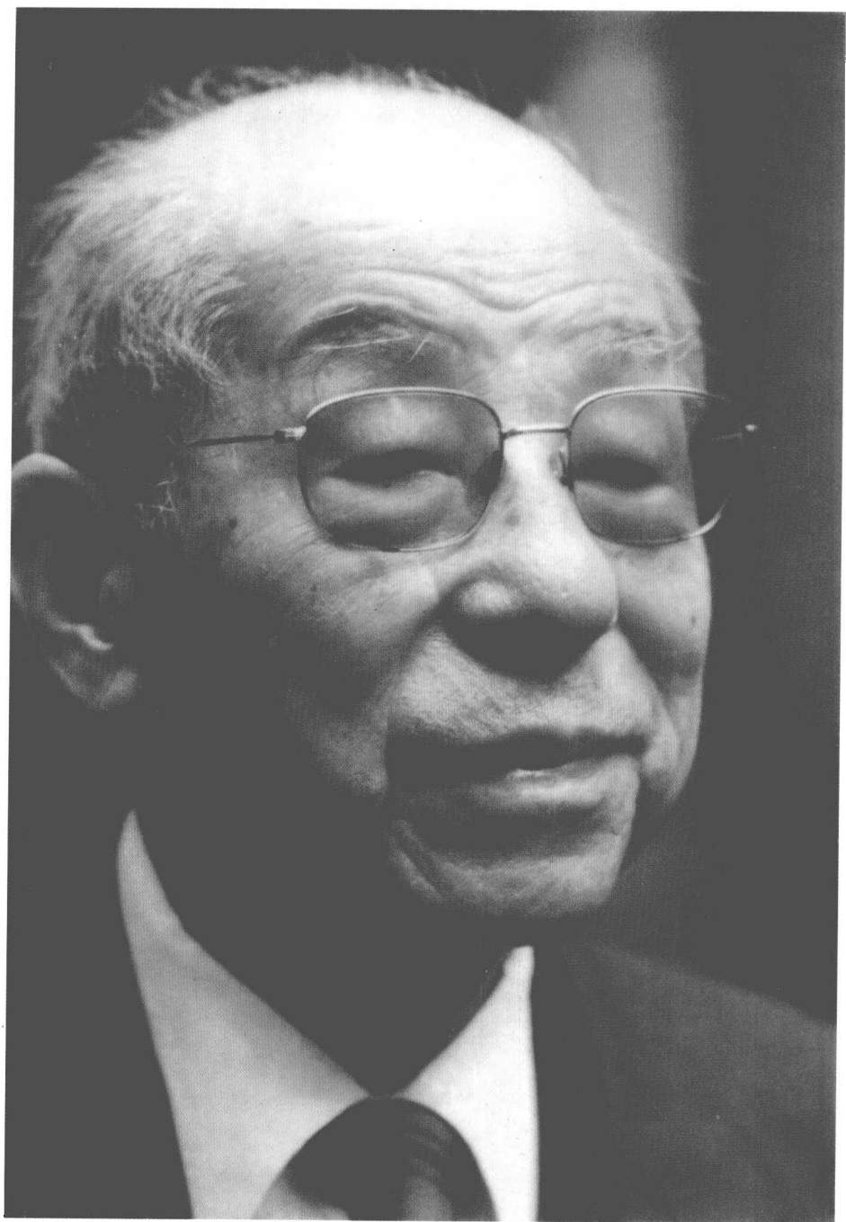
晚年时期的张学良将军