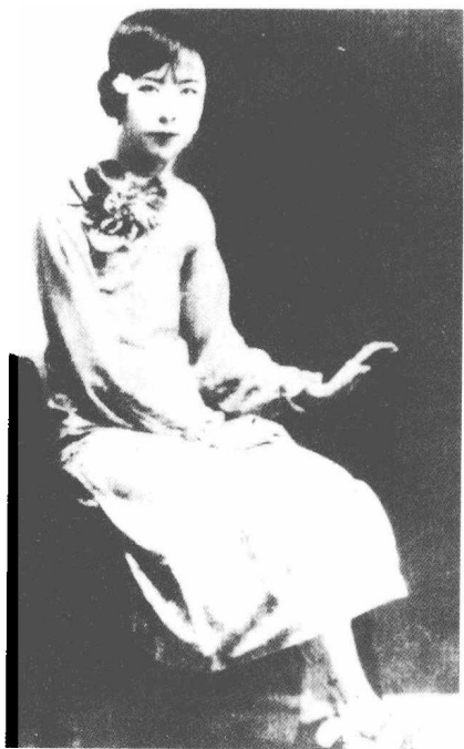
青年时期的于凤至