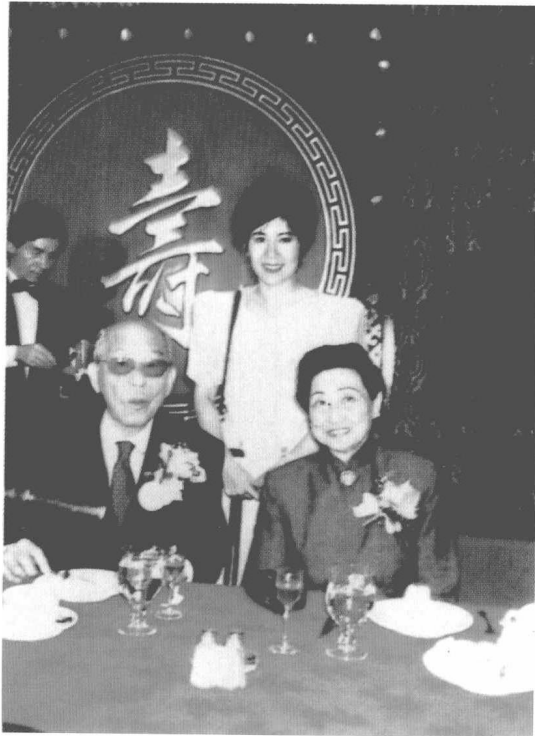
张学良与夫人赵一荻在祝寿会上