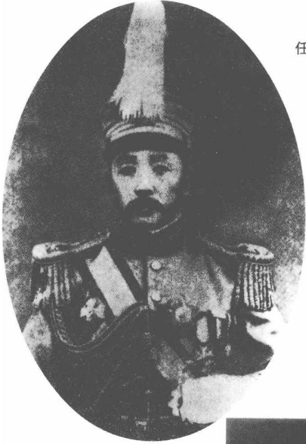
任安国军大元帅时的张作霖