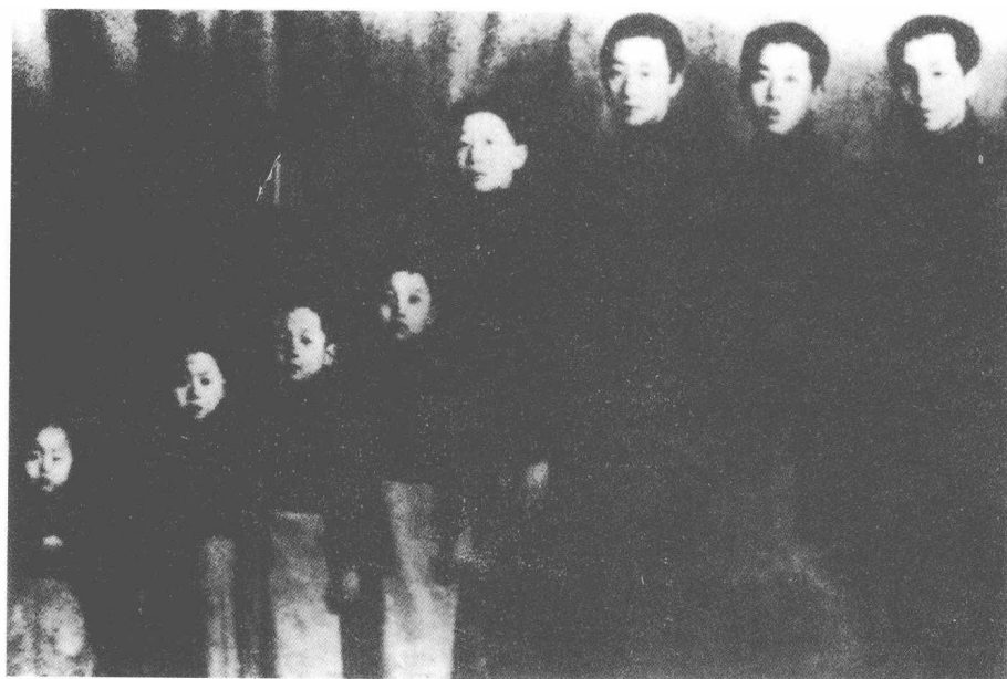
张学良与弟弟学铭、学曾、学思、学森、学俊、学英、学铨合影