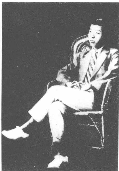
少年时期的张学良