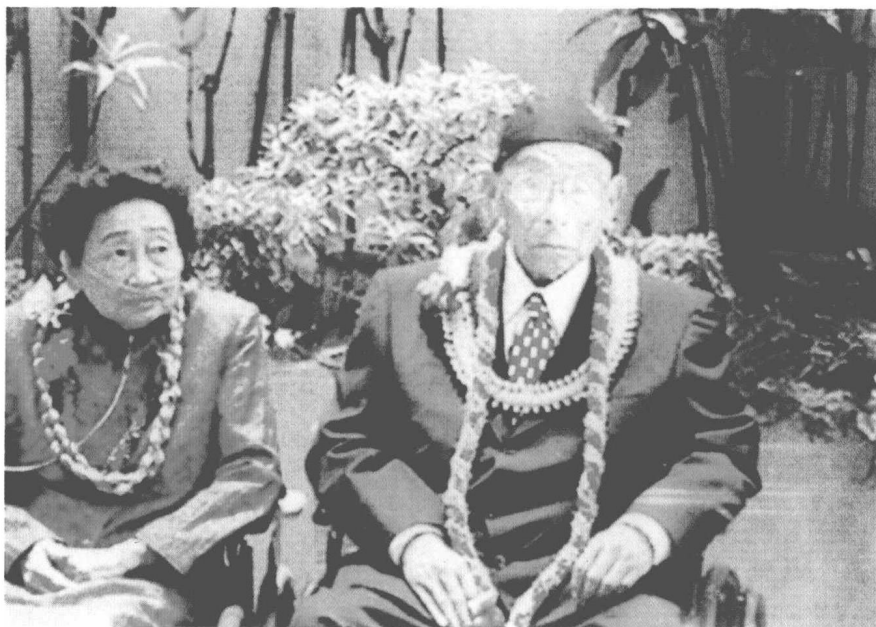
百年华诞会上的张学良先生和赵一荻女士（2000年6月）