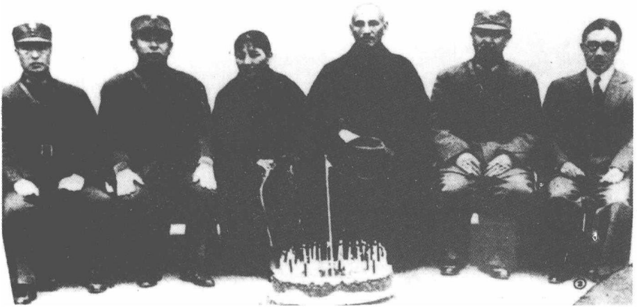
西安事变前张学良与蒋介石、阎锡山等在洛阳