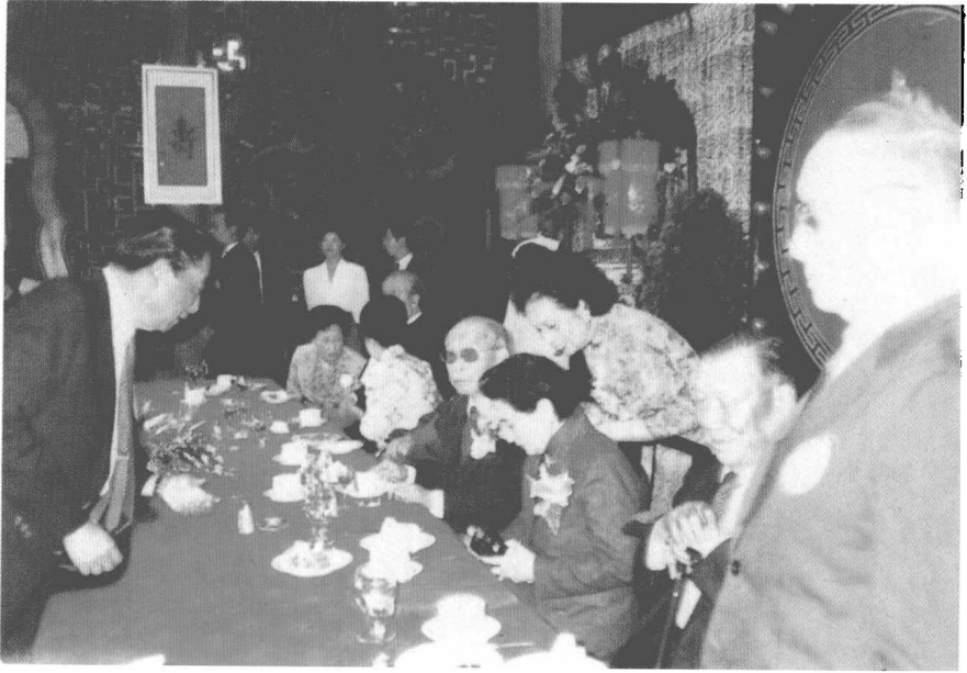
1990年6月1日，张学良将军在九秩华诞寿宴上