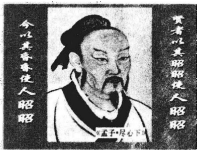
图1-1 孟子的经典论述

想起这句话，我们就联想到了当今很多家长，不禁莞尔，他们在教育孩子这件事情上，真的是“家长以自己的昏昏努力使孩子昭昭”啊！