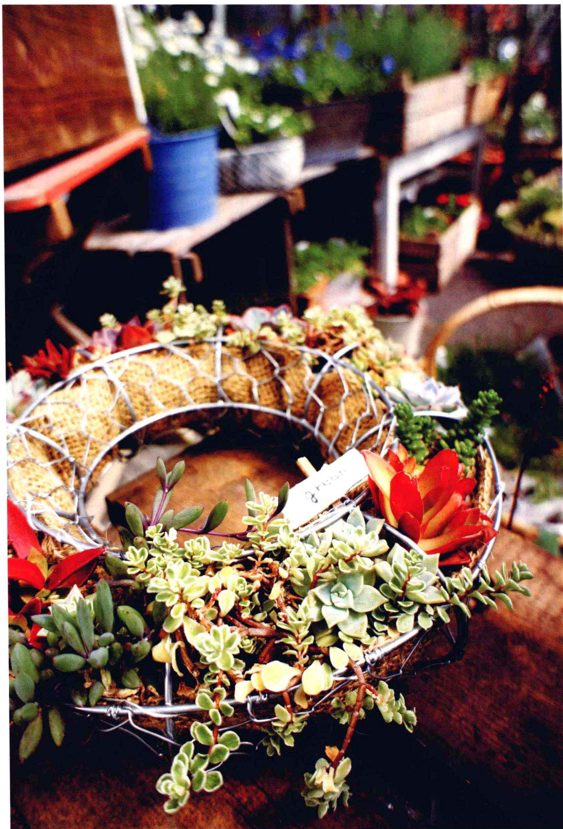
NEX-5 / E 16mm F2.8 / 光圈优先 F4 1/2500 秒 ISO400 白平衡 : 日光