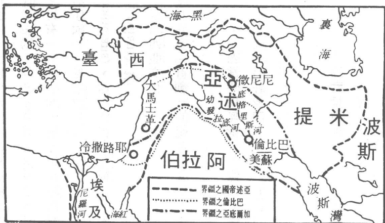
圖一第 西亞各國疆界圖

肥沃月彎的東端，稱爲兩河流域。早在西元前五千年左右，蘇美人(Sumerians)已經發展農業，建立了許多小小的城邦。肥沃月彎的東北是山岳地帶，南方是阿拉伯沙漠，原來住在那些地方的山居人和游牧民族，都因生活不易，紛紛侵入肥沃