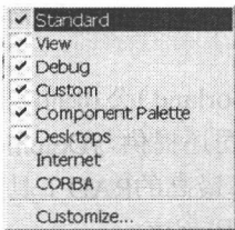
图 1-2 工具栏上的快捷菜单

另外，在程序开发的过程中，读者可以在不同的情况下，在界面的不同部位单击鼠标右键，看看是否有一些右键弹出菜单出现，并进一步了解通过这些弹出菜单能实现什么新的功能或快捷操作。