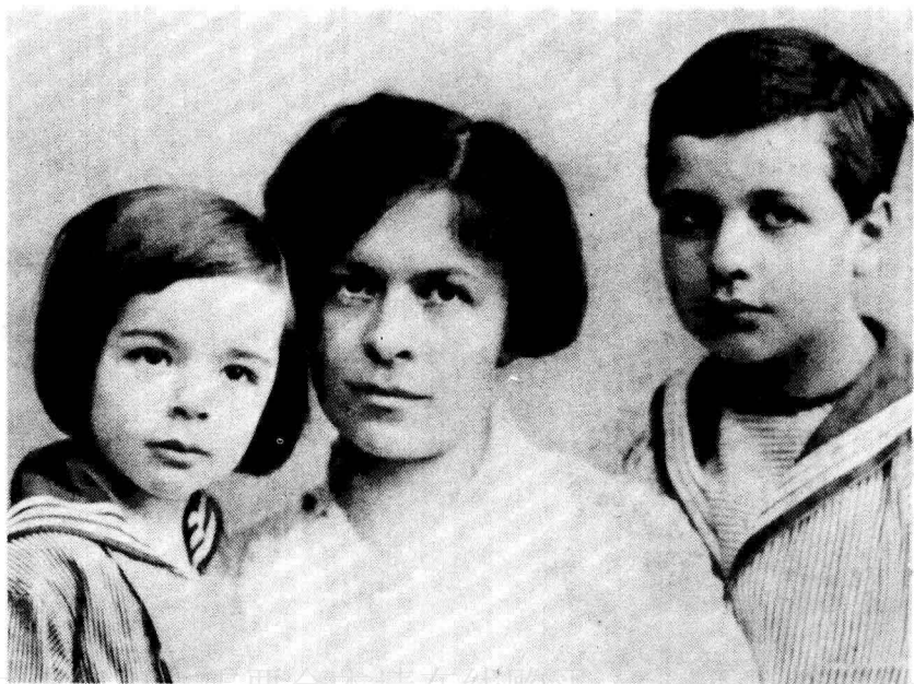
愛因斯坦妻子米莉娃與女兒及兒子合影。