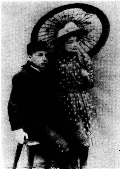
愛因斯坦與妹妹瑪雅合影，約14歲時。