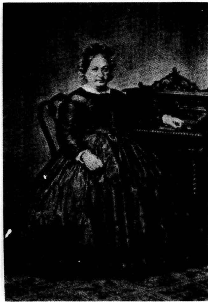
愛因斯坦的祖父母。