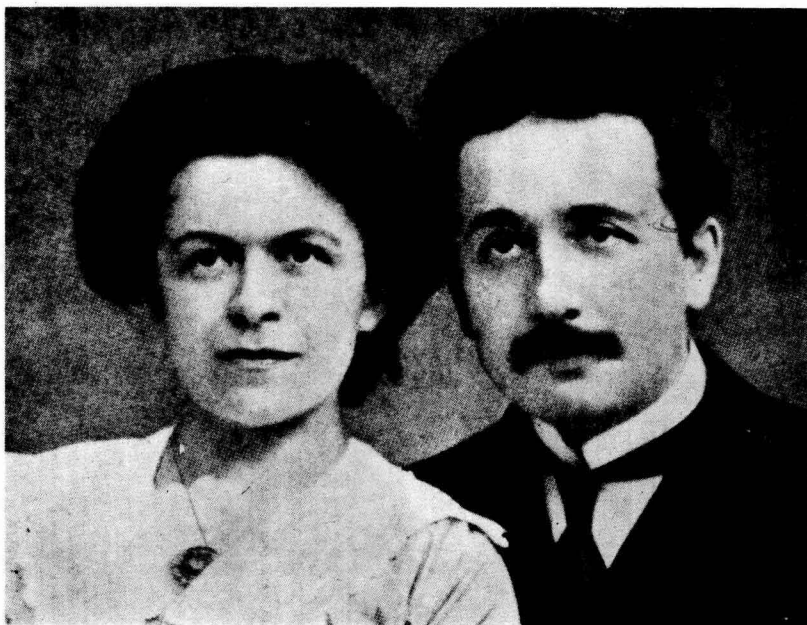
愛因斯坦(Albert Einstein, 1879~1955)與其第一任夫人