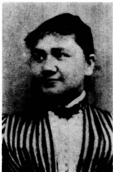
愛因斯坦的父親與母親。