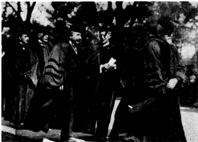
1921年在普林斯頓接受名譽學位。