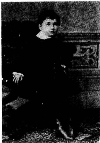
現存愛因斯坦最早的照片。