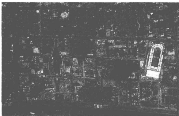
图 1.1 珠江新城中的“城中村”洗村、猎德村卫影像图

伴随城市扩展过程，出现了城市建设用地包围原有农村聚落的“城中村”现象，在全国 660 个城市中，城中村人口大约占城市人口的 10%，在市域内的农民约为 3.2 亿人（周干峙 2005），由于我国现时的城市化制度不能够适应城市化进程的要求，使得城中村成为城市规划和城市管理中的一个盲区，出现了城中村管理问题“谁都不管，谁都管不了”的现象，从而导致城中村人居环境的恶化，已经成为城市中的毒瘤，严重影响了城市的正常发展秩序，以及城市化和现代化的健康推进。城中村是城市发展过程中的一种形态过程，那么在城市发展过程中如何避免出现城中村人居环境的恶化，促使城中村融入城市的人居环境，是我国城市化过程中必须解决的问题。