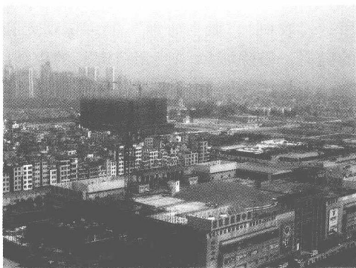
图 1.2 洗村的违章建筑