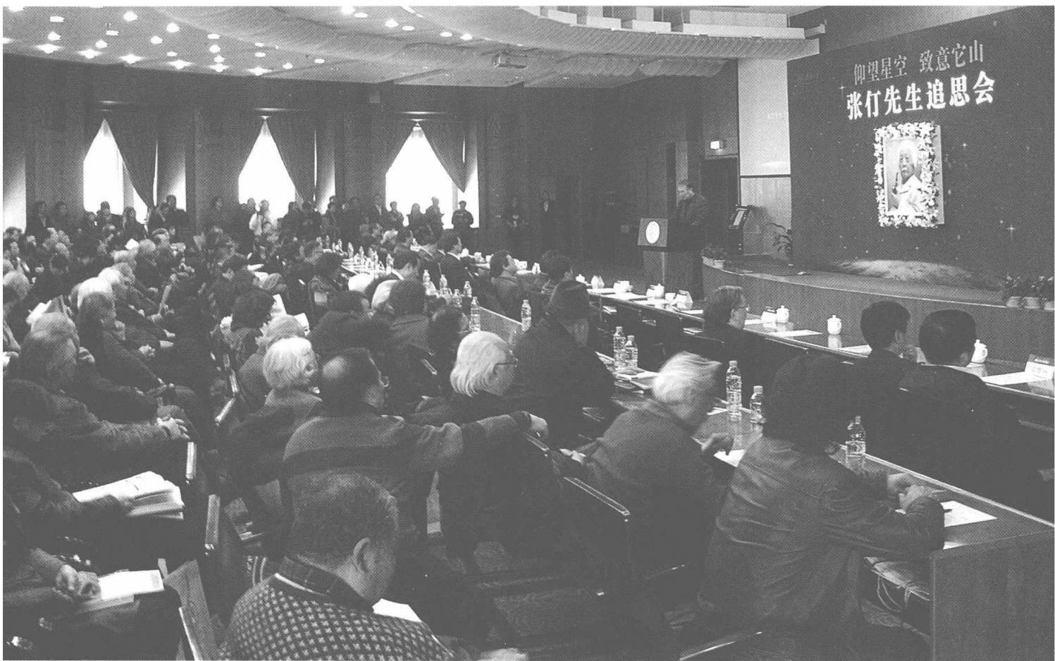
“张竹先生追思会”现场一角