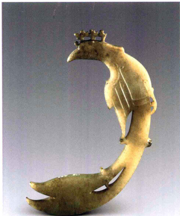
彩图 14 河南安阳殷墟妇好墓出土玉凤