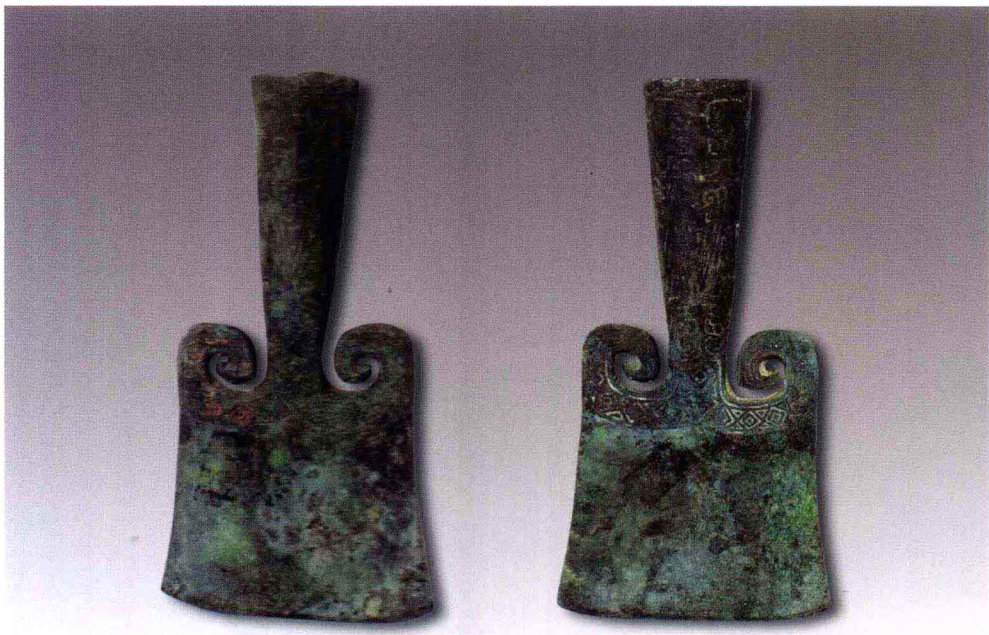
彩图 13 河南安阳西北冈 1005 号大墓出土铜钺