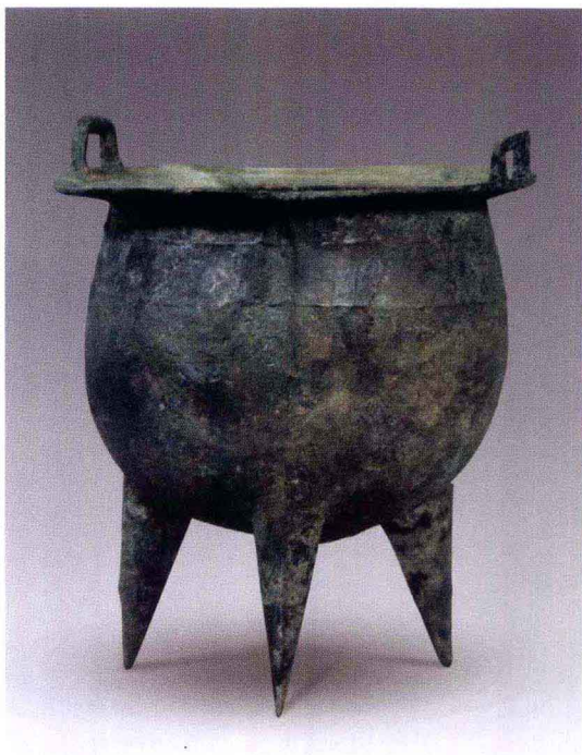
彩图 7 山西垣曲商城出土铜鼎