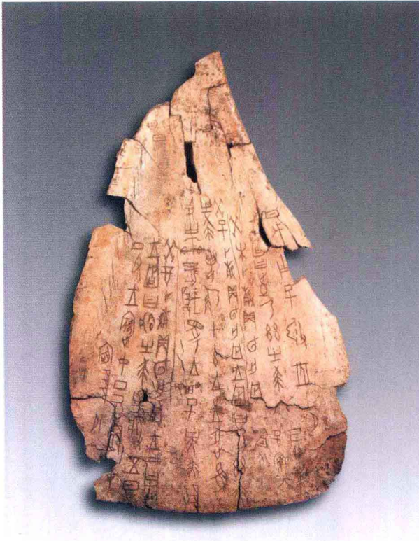
彩图1 商王卜问每旬活动的祸忧