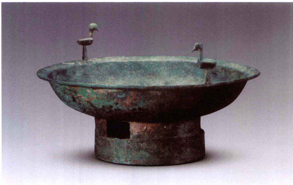
彩图 9 北京平谷刘家河商墓出土鸟柱鱼纹铜盘