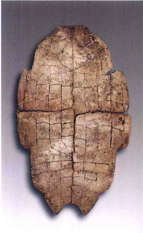
彩图 3 龟腹甲卜辞记祭祀先妣