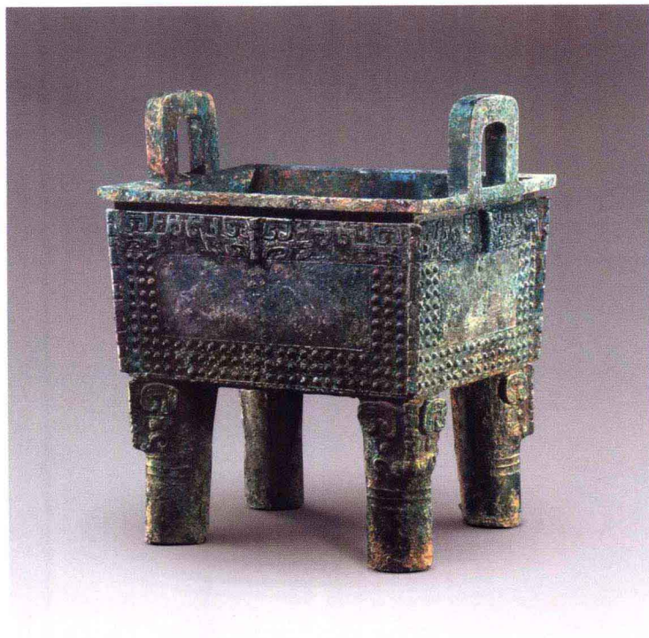
彩图 6 河南安阳殷墟 妇好墓出土后 母辛方鼎