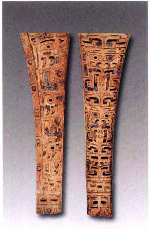
彩图 4 河南安阳殷墟出土绿松石镶嵌雕花骨柄