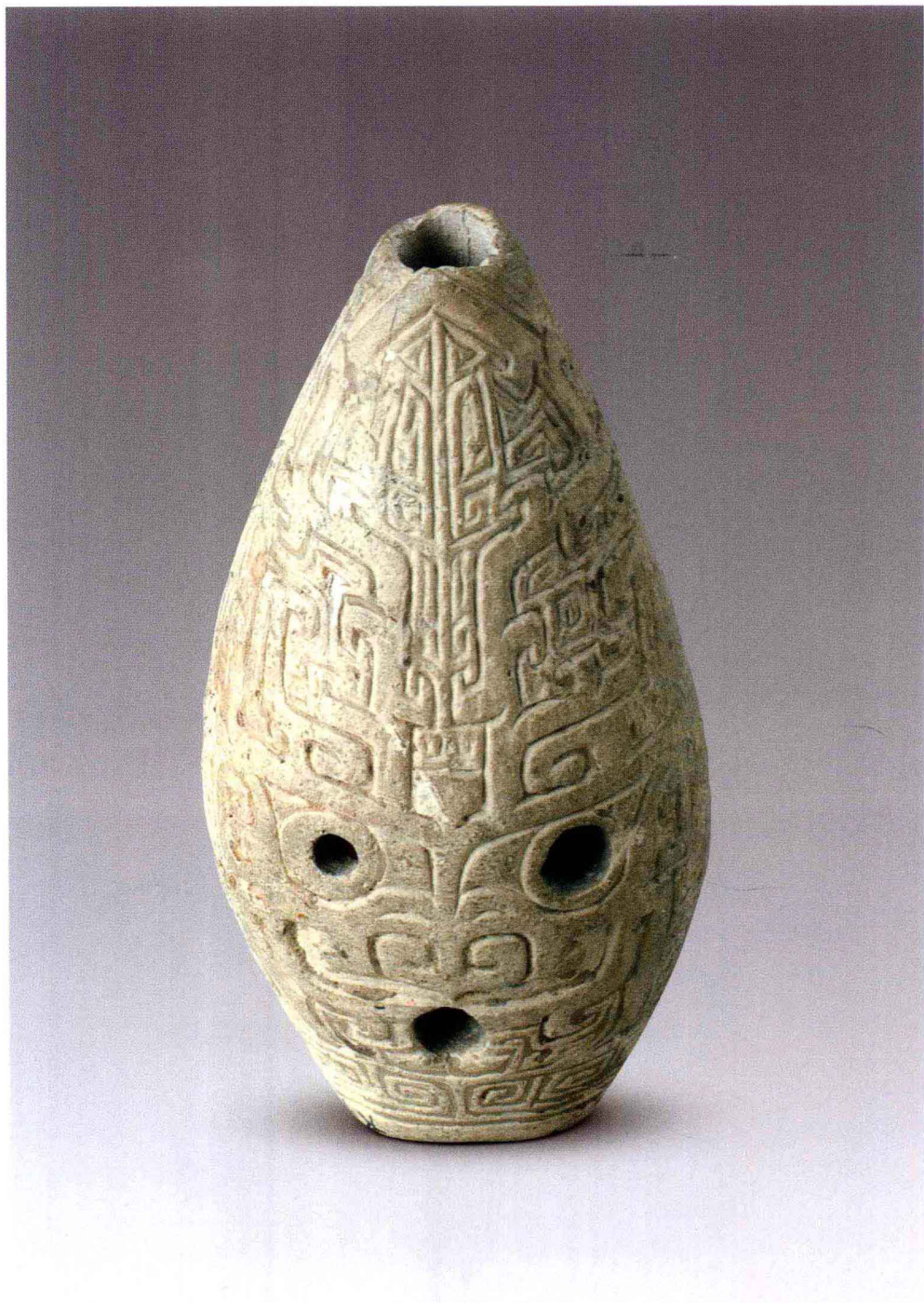
彩图 16 河南安阳小屯 333 号墓出土白陶埙