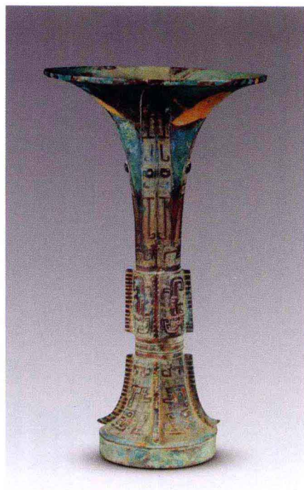
彩图 8 山西灵石旌介商墓出土青铜觚