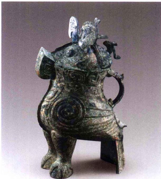
彩图 12 河南安阳殷墟妇好墓 出土鸮尊