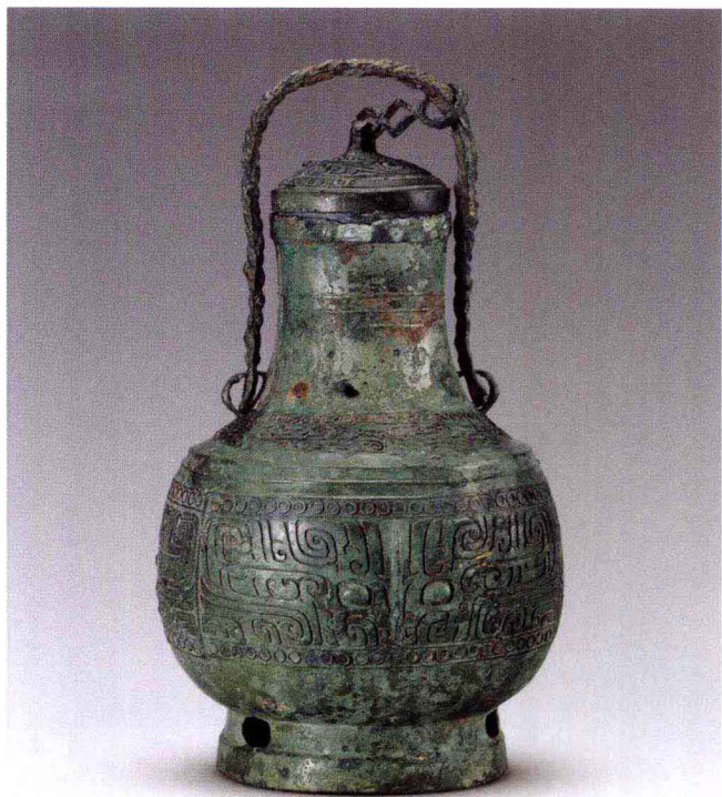
彩图 10 湖北黄陂盘龙城遗址 出土商代提梁卣