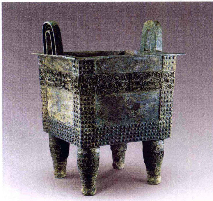
彩图 5 河南郑州商城出土青铜方鼎