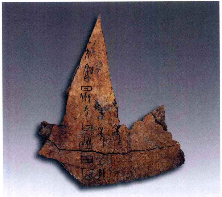
彩图2 甲骨文记“王大令众人协田”