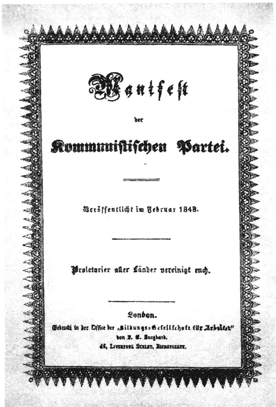
《共产党宣言》1848年版封面