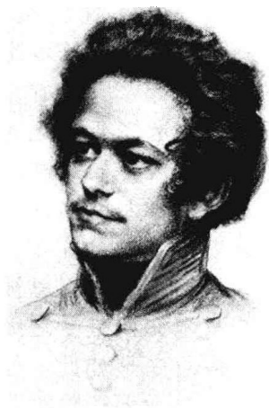
青年马克思 (摄于1839年)