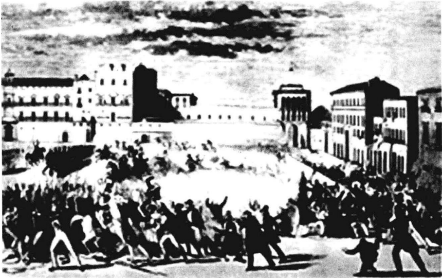
1848 年意大利巴勒摩人民起义反对王室

这是欧洲大革命时期。这场革命发端于意大利，首先波及法国。法国巴黎民众于 1848 年 2 月 22 日举行武装起义，推翻了七月王朝，宣布建立法兰