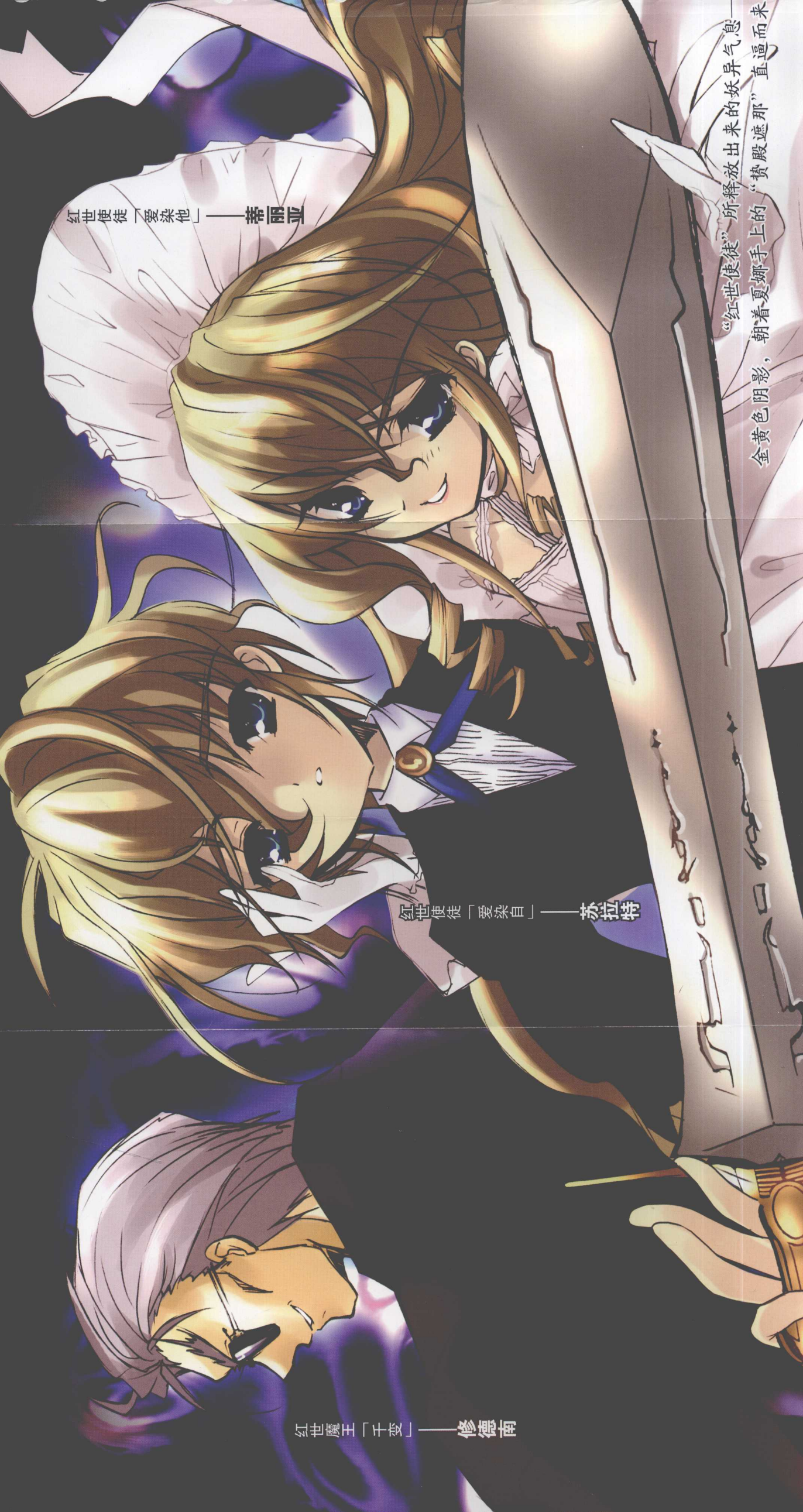
红世使徒「爱染他」——蒂丽亚