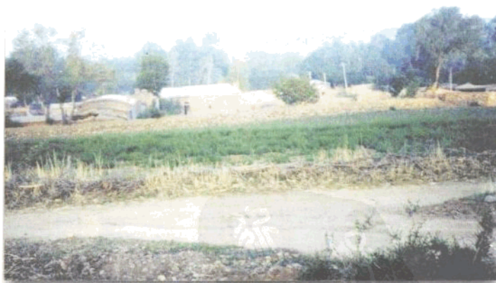
我就出生在这个家