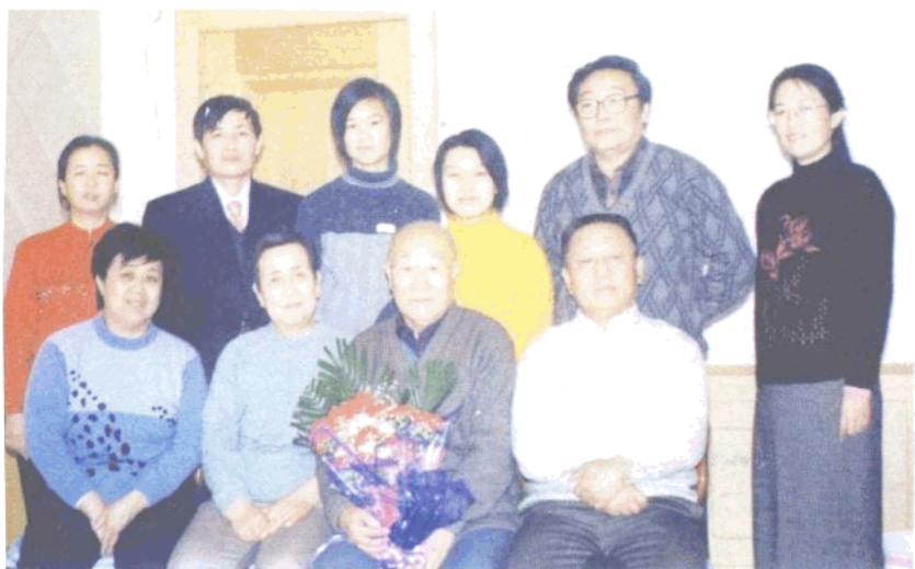
2002年春节家庭部分成员合影于锦州