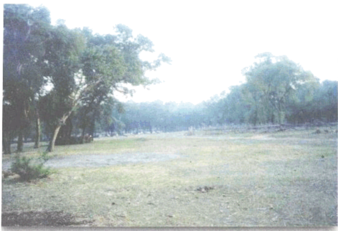
我家房前的沙拉勿束河