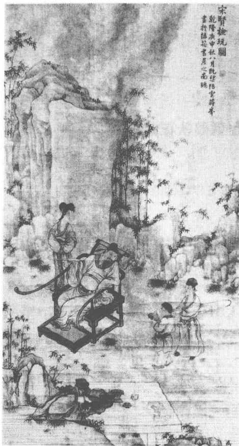
清 蔣峰 宋賢檢玩圖