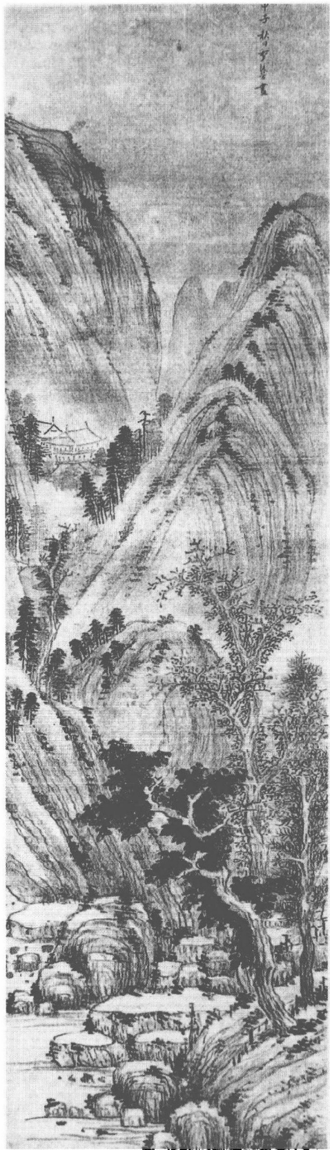
明 李流芳 溪山樓閣圖