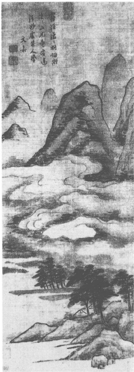
明 文嘉 淡山煙霧圖