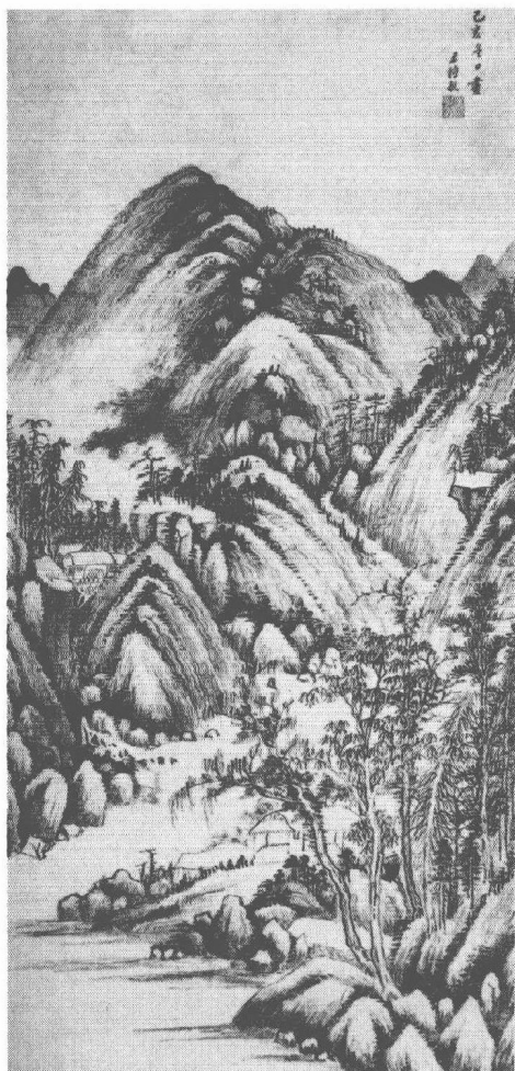
清 王時敏 溪邨晚霽圖