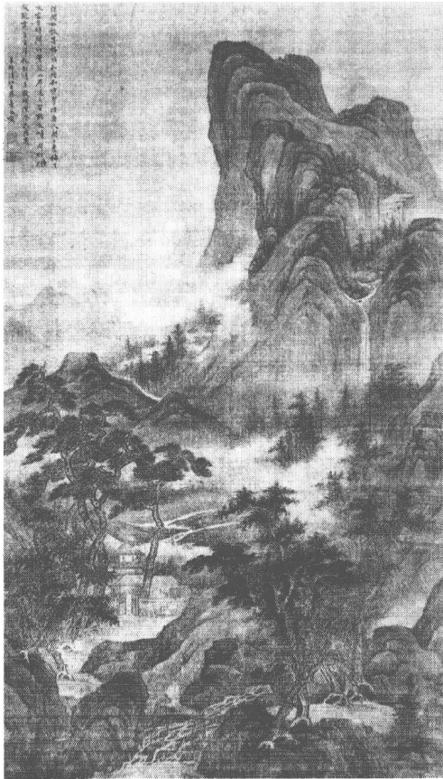
清 章谷 雲壑松風圖