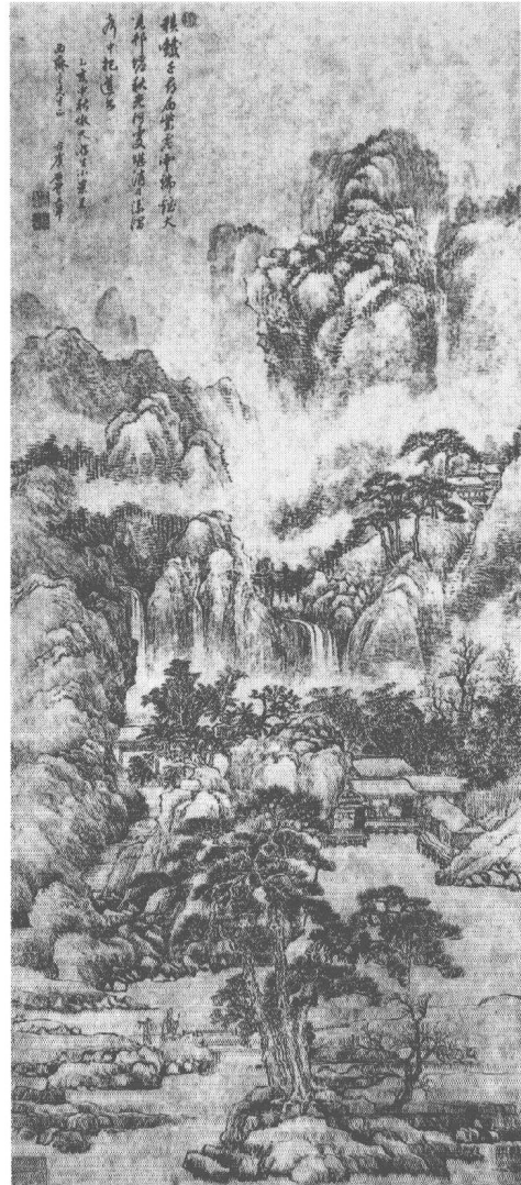
清 王翬 做天游生紫虛托道圖