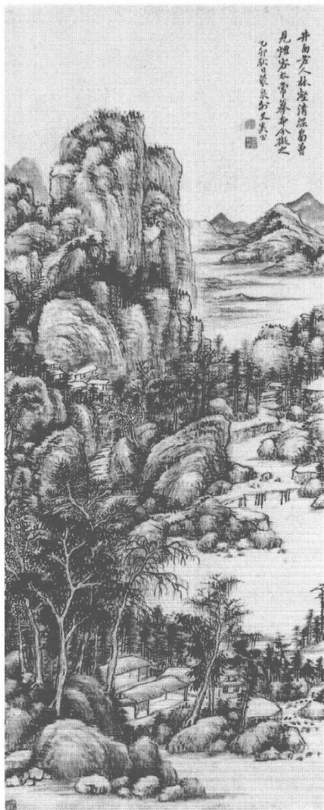
清 奚岡 林壑清深圖