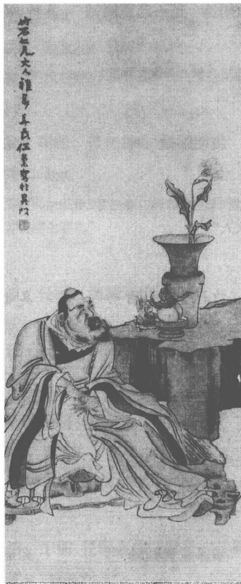
清 任薰 閒坐圖