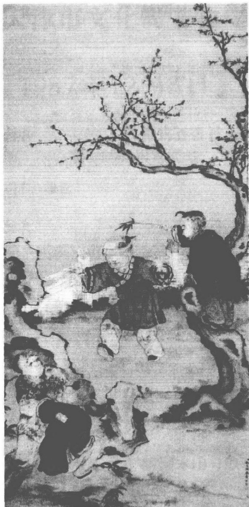
清 姚文瀚 嬰戲圖