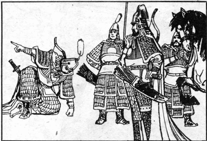
5 大臣正跑着，遇到正在巡逻的李广。