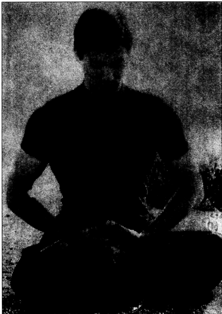
精神修炼中的李小龙