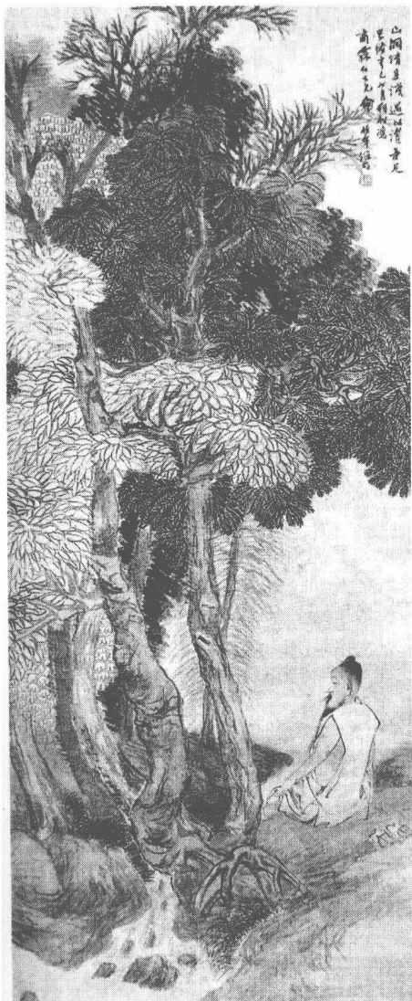
清 任頤 清溪濯足圖