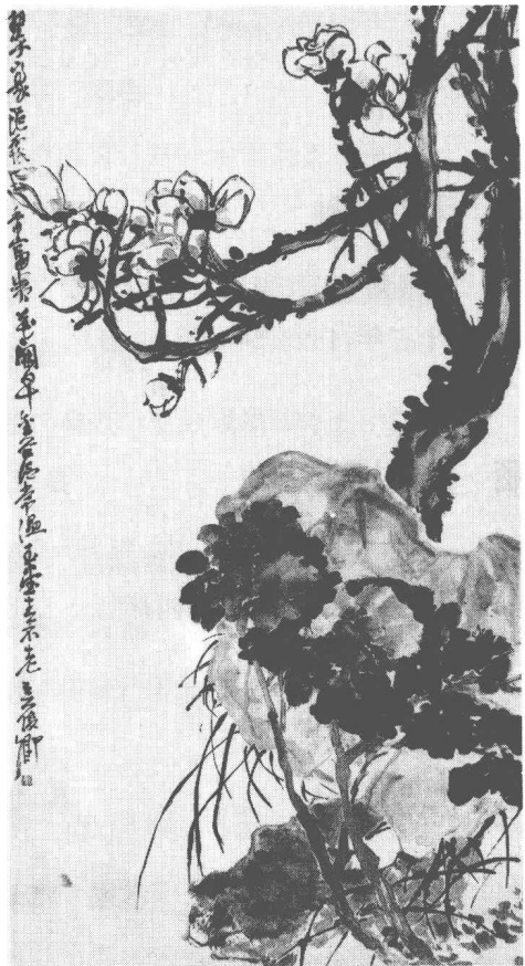
清 吳昌碩 玉堂富貴圖