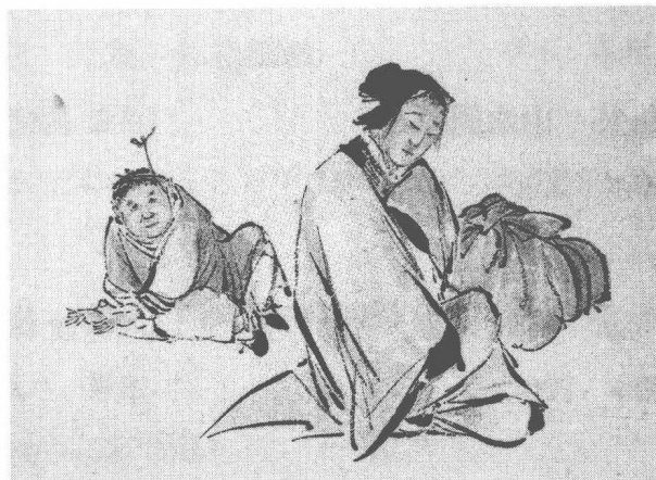
清 任薰 江湖流民圖(之二)