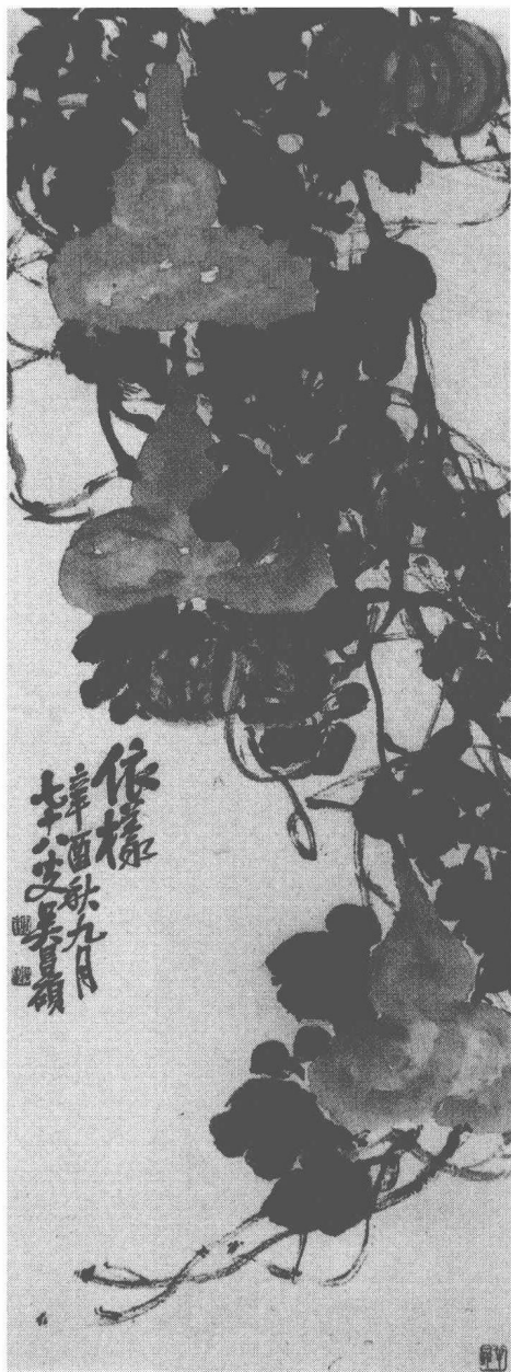
清 吳昌碩 葫蘆南瓜圖