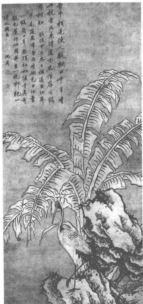
明 沈周 蕉鶴圖