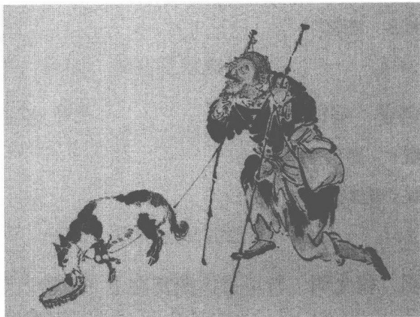
清 任薰 江湖流民圖(之一)