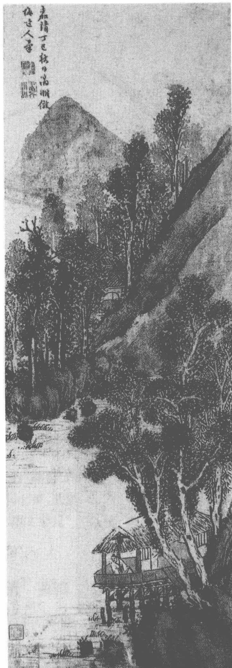
明 文徵明 做梅道人山水圖