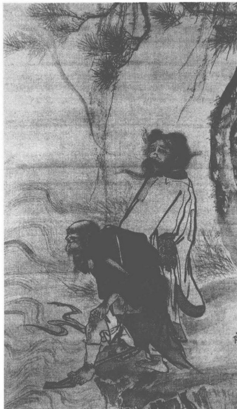
明 吳偉 二仙圖軸

題：“揮毫已寫竹三竿，竹下還添幾筆蘭。總為東源同七穆，欲修舊譜與君看” “觀文家兄”上款