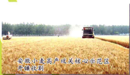
安徽小麦高产攻关核心示范区 开镰收割

2009年,安徽各地深入推进小麦高产攻关活动、水稻产业提升行动和玉米振兴计划,强化惠农政策落实,大力推进科技兴粮,克服50年一遇的冬春特大干旱、夏季高温热害和秋季连阴雨寡照与暴雨台风等不利因素的影响,粮食生产保持良好的发展态势。