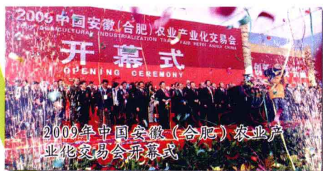
2009年中国安徽(合肥)农业产 业化交易会开幕式