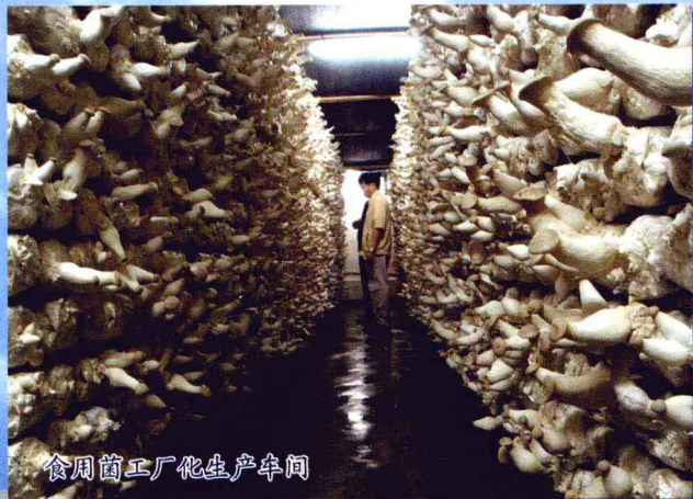
食用菌工厂化生产车间