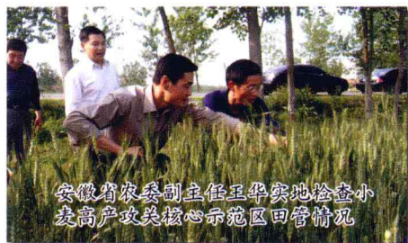
安徽省农委副主任王华实地检查小 麦高产攻关核心示范区田管情况