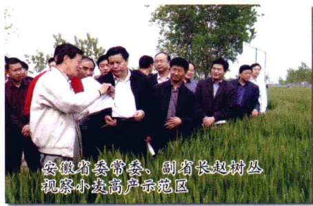
安徽省委常委、副省长赵树丛 视察小麦高产示范区