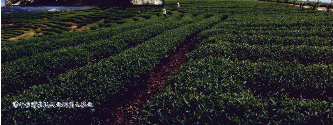
漳平台湾农民创业园高山茶业