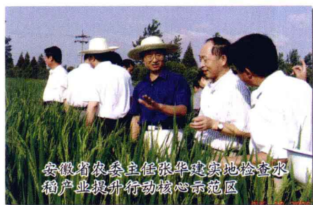
安徽省农委主任张华建实地检查水 稻产业提升行动核心示范区