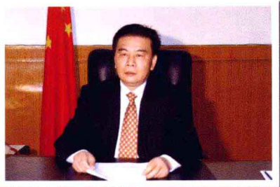
农业厅党组书记、厅长 毛惠忠

江西是一个农业比重较大的省份，农业在全省国民经济中占有重要地位，以占全国1.8%的耕地，生产了占全国4%的粮食，是新中国成立以来从未间断输出商品粮的两个省份之一，为保障国家粮食安全作出了重要贡献。