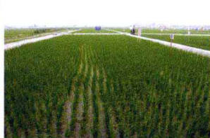
粮食高产创建万亩示范片