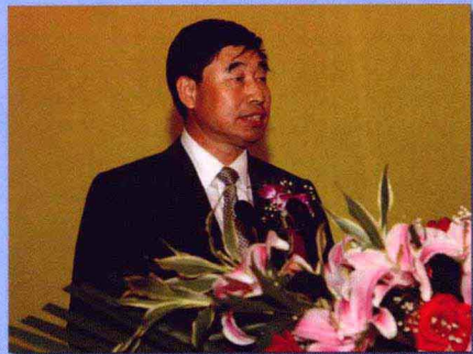
省农委党组书记、主任 王忠林

2009年,黑龙江省认真贯彻中央农村工作会议精神,全面落实省委、省政府关于农业农村工作的重要部署,深入实施千亿斤粮食产能工程和新农村建设工程,加快推进松嫩、三江两大平原农业综合开发试验区建设,落实强农惠农政策,优化农业农村经济结构,深化农村改革,拓宽农民增收渠道,全省农业农村经济社会发展取得了显著成效。