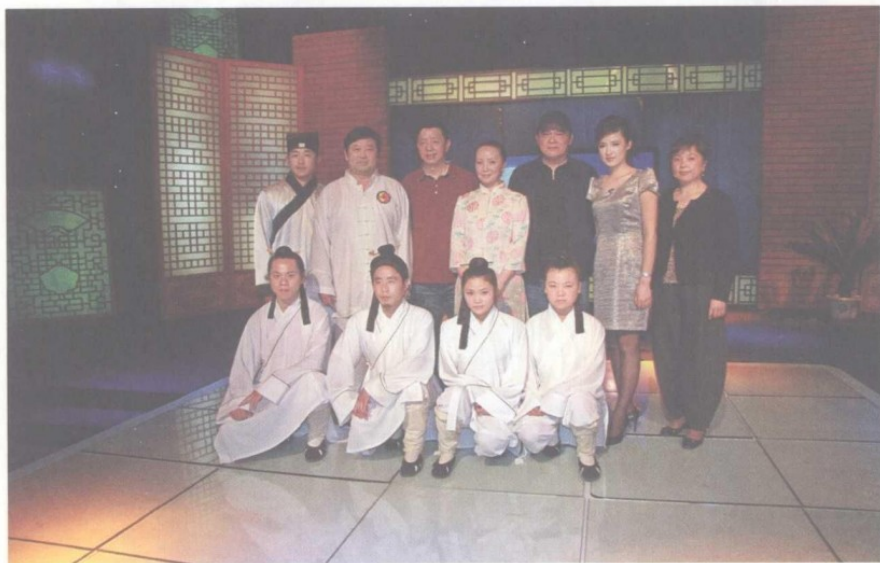
节目全体人员合影