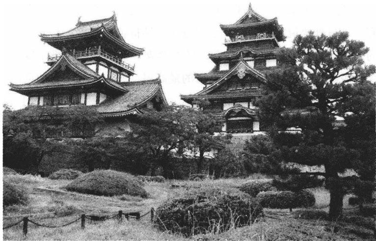
伏见桃山城：伏见桃山城是丰臣政权在京都的政治中心， 丰臣政权时代因此被称为桃山时代

间”，这种商业团体后来也获得了官方的认可而存在。商人通过垄断地位控制了财权，实际地位上升。而作为统治阶层的武士，由于作为硬通货的米价格下跌，陷入了贫困的境地。米价的下跌还进一步导致了农民的贫困，江户时代后期，许多农民陷入破产。农村的贫富差距拉大，导致农村的暴乱“一揆”此起彼伏。