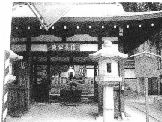
本能寺：本能寺是织田信长因部下明智光秀叛变而被杀的处所，今其寺中有信长公庙。

江户幕府是建立在日本战国时代以来的变革基础之上的，战国时代的“革命者”，首推织田信长，后人评价说“其卓见使日本得吸世界之新空气，以资益其将士之智能，以涵养日本勃兴之渊源” ① 。而丰臣秀吉作为信长的继承人，他和信长一起成为战国时代变革的集大成者。其后的江户时代在很多地方都可以找到战国和织丰政权时代留下的影子。