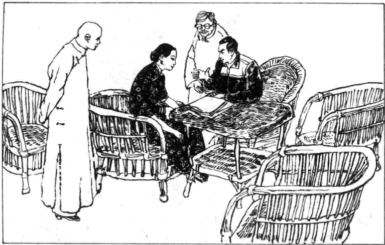
12 顾祝同把昔憬介绍给宋美龄后，宋美龄对昔憬颇为赏识，居然让昔憬坐在她身边，和他讨论起建筑艺术来了。