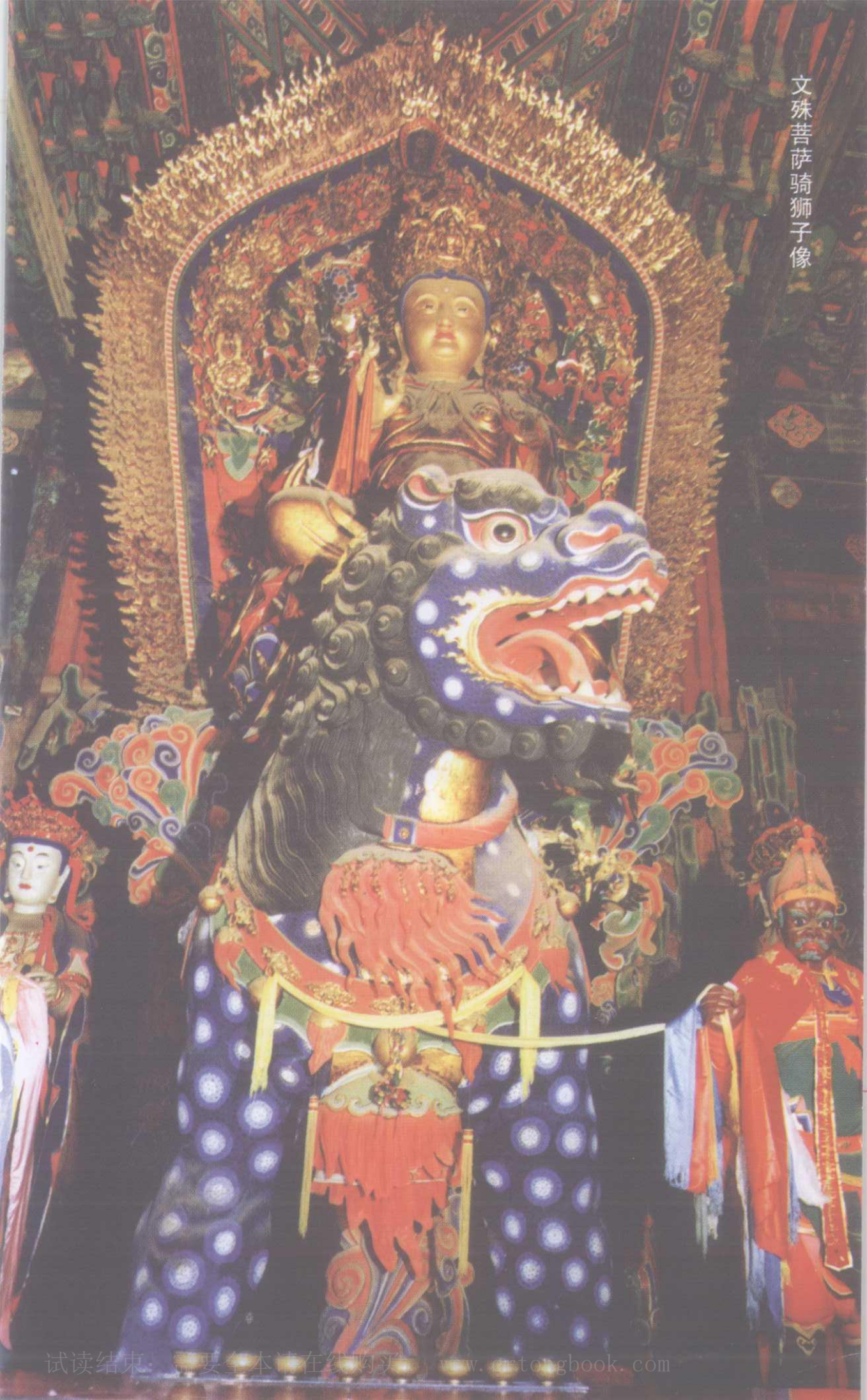
文殊菩萨骑狮子像