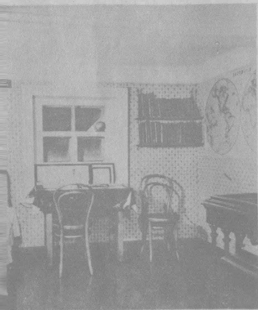
列寧幼年住過的房間。