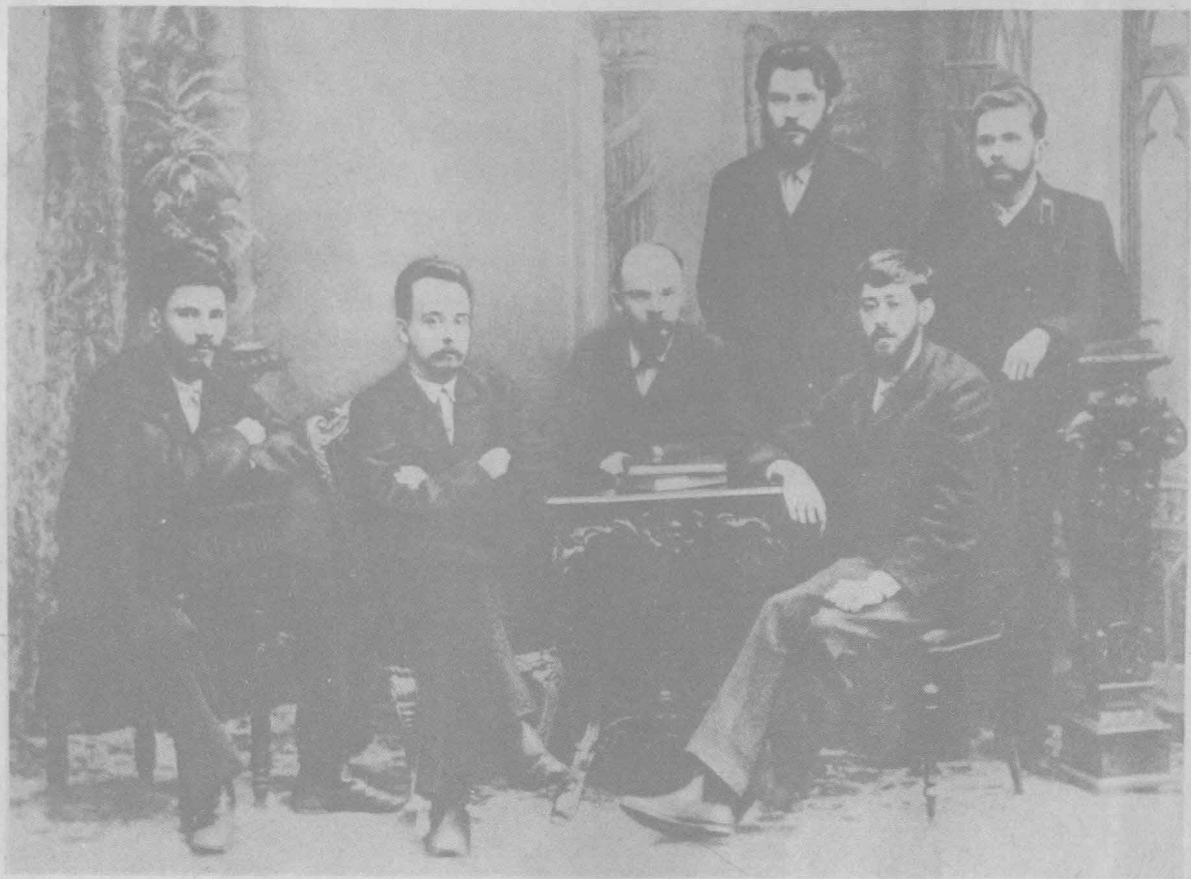
一八九五年秋，列寧從國外回來後，便着手鞏固和擴大社會民主黨人的組織。列寧把彼得堡約二十個馬克思主義工人小組，組成了“工人階級解放鬥爭協會”。這樣一來，他就準備了創立革命的馬克思主義黨的基礎。圖為彼得堡“工人階級解放鬥爭協會”會員合影。