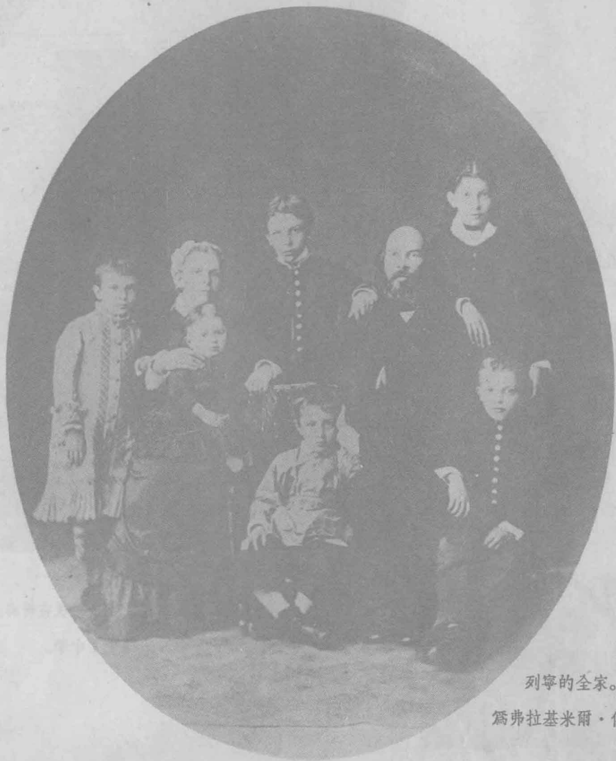
列寧的全家。前排右起第一人 爲弗拉基米爾·依里奇·列寧。