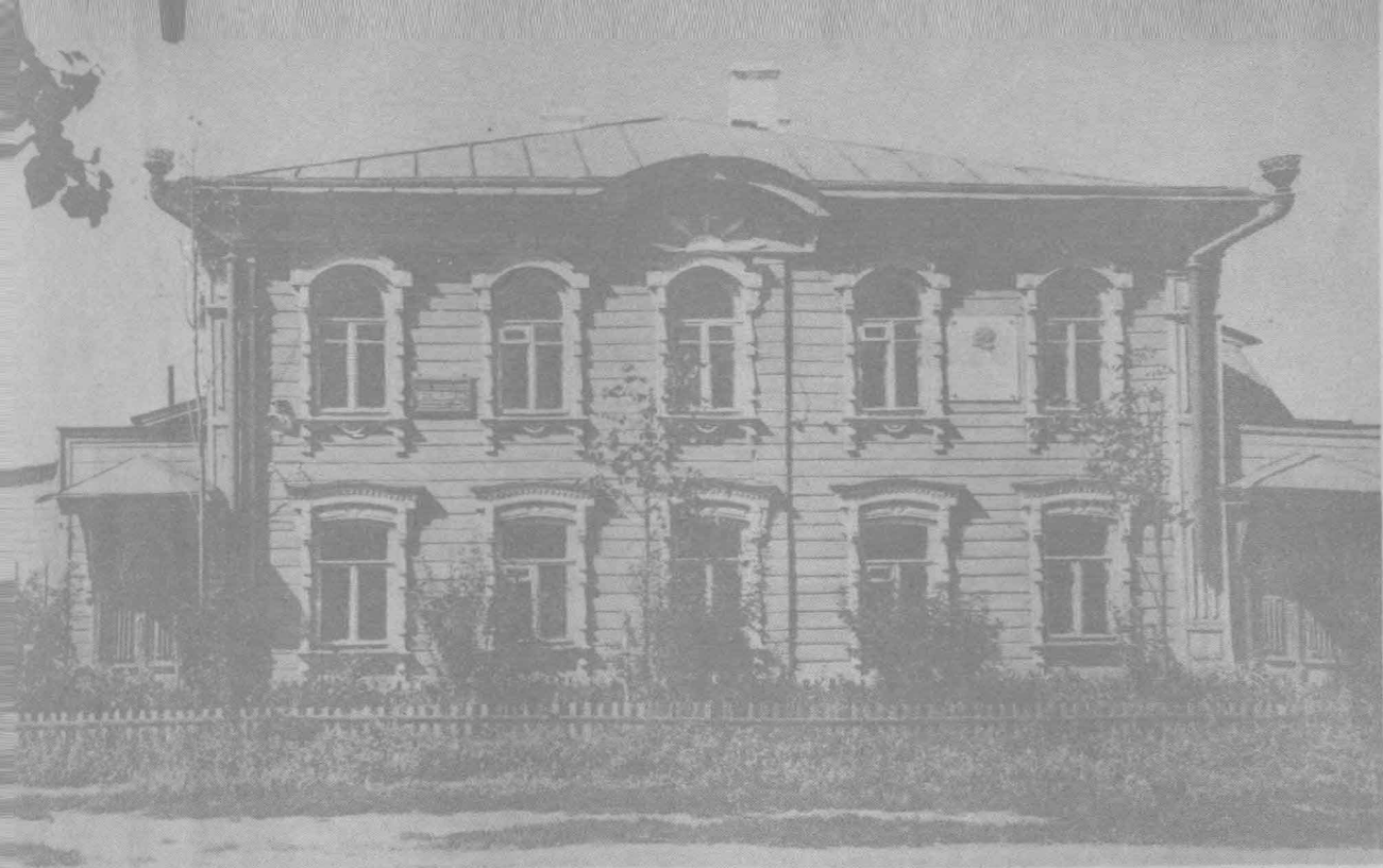
一八七〇年四月二十二日，列寧誕生在這所房子裏。