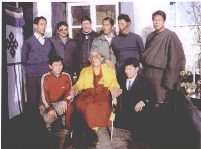
与儿子、女婿、孙儿合影