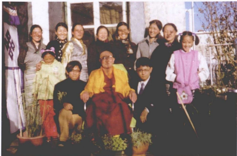
与女儿、儿媳、孙儿、孙女等合影