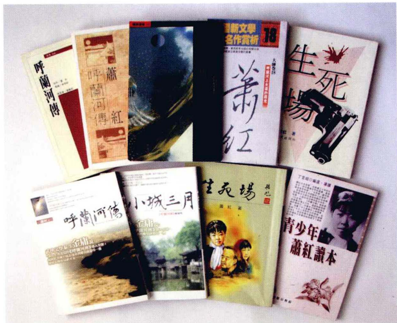
中国台湾出版的部分萧红作品