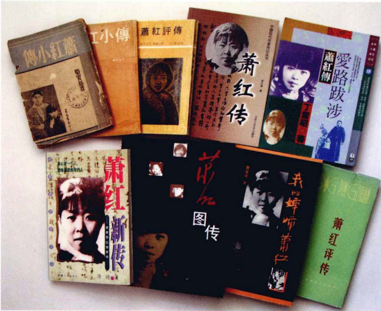
蕭紅传记部分版本