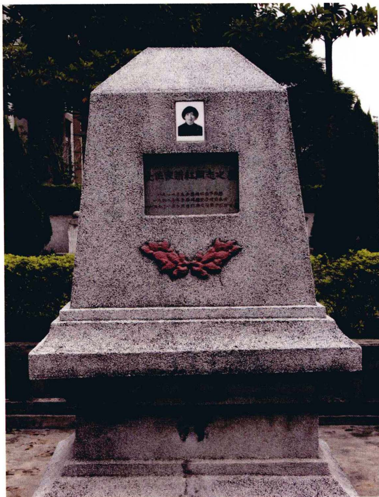
广州银河公墓内的萧红墓