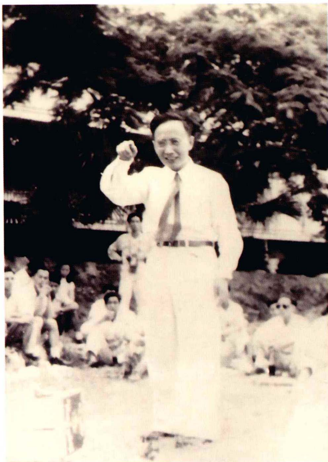
1948年郭沫若在香港浅水湾萧红墓前发表演讲