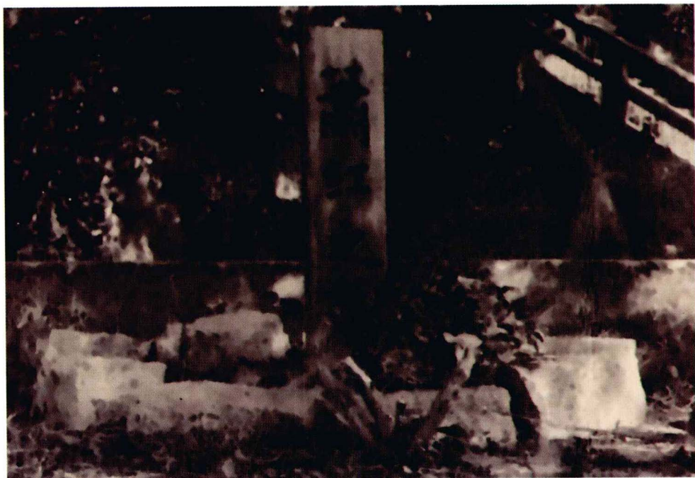
葬于香港浅水湾的墓地 (1957年迁葬广州银河公墓)