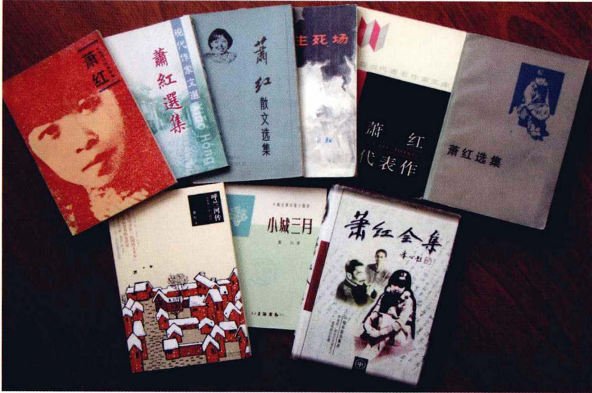
蕭紅作品部分版本