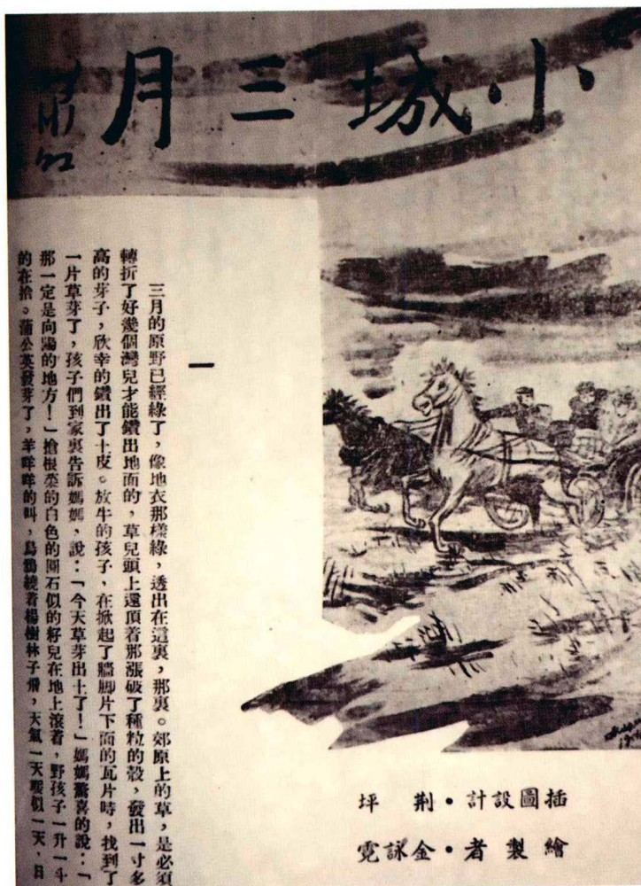
《小城三月》初刊书影