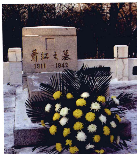
呼兰西岗公园内的青丝墓