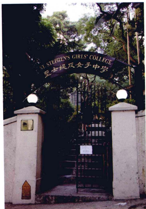
病逝地——香港圣士提反女校旧址， 其一半骨灰葬于校园内