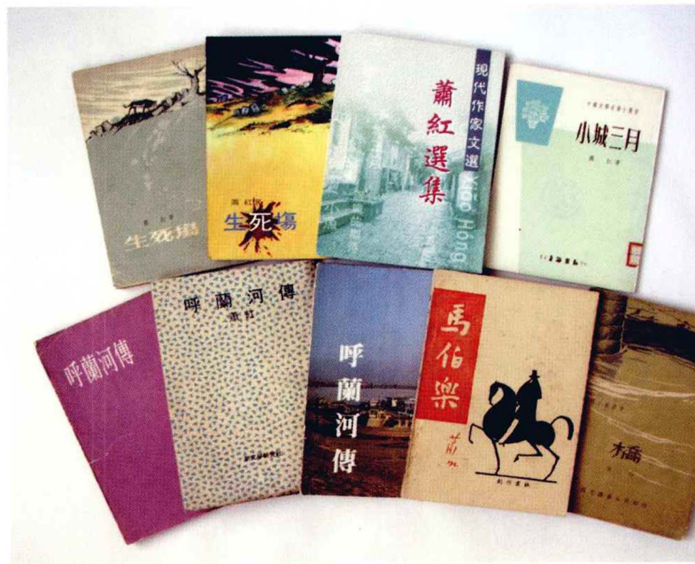
中国香港出版的部分萧红作品