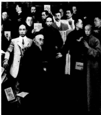
《北大钟声》(油画,作者:沈加蔚)

子。在同工人群众相结合的过程中,知识分子逐步认识到,要从根本上改造中国,必须走俄国十月革命的道路,必须建立一个布尔什维克的共产党。