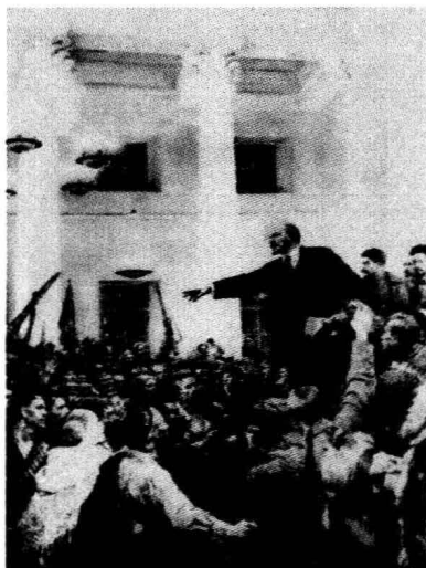
列宁宣布苏维埃政权成立(油画,作者:[苏]弗·谢罗夫)