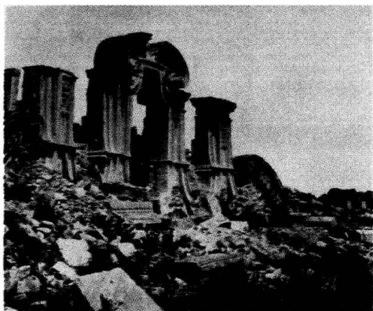
被英法联军抢劫、烧毁的圆明园残迹

落后就要挨打。 鸦片战争中，英国侵略者凭借船坚炮利强行打开了中国的大门。鸦片战争后，中国一步一步沦为半殖民地半封建社会。然而，优秀的中华儿女不甘屈辱、发