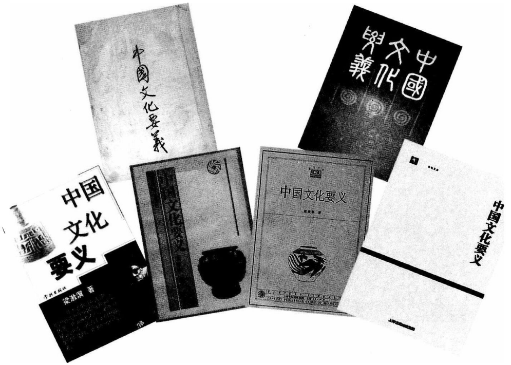
《中国文化要义》部分版本