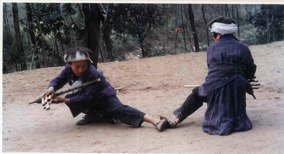
苗族芦笙舞