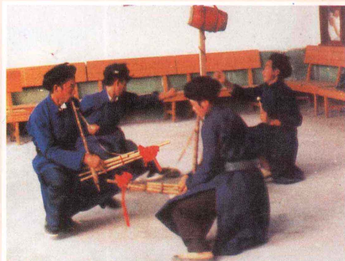
苗族笙鼓舞阿仿