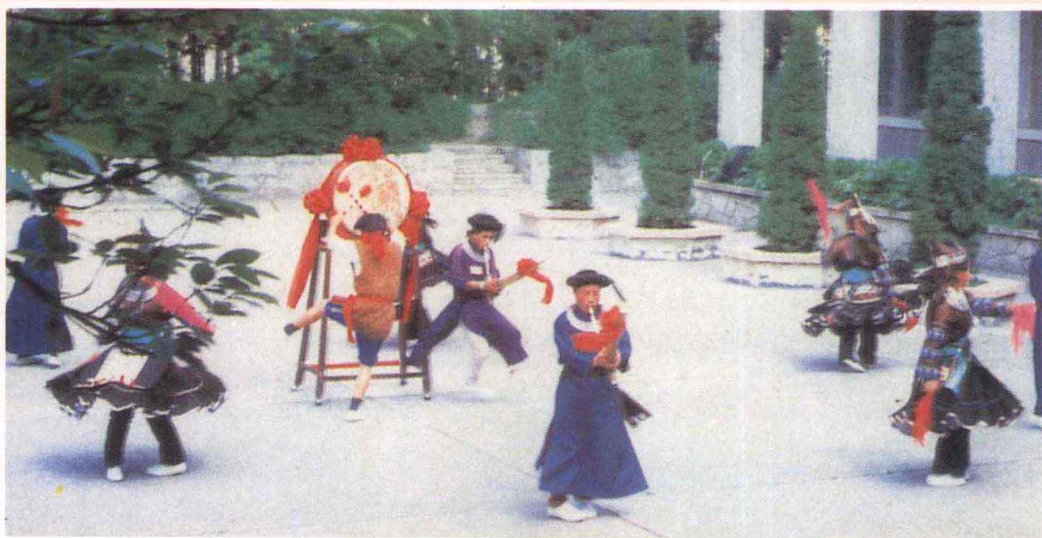
苗族猴鼓舞