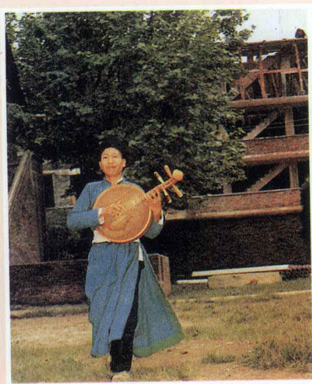
彝族月琴舞