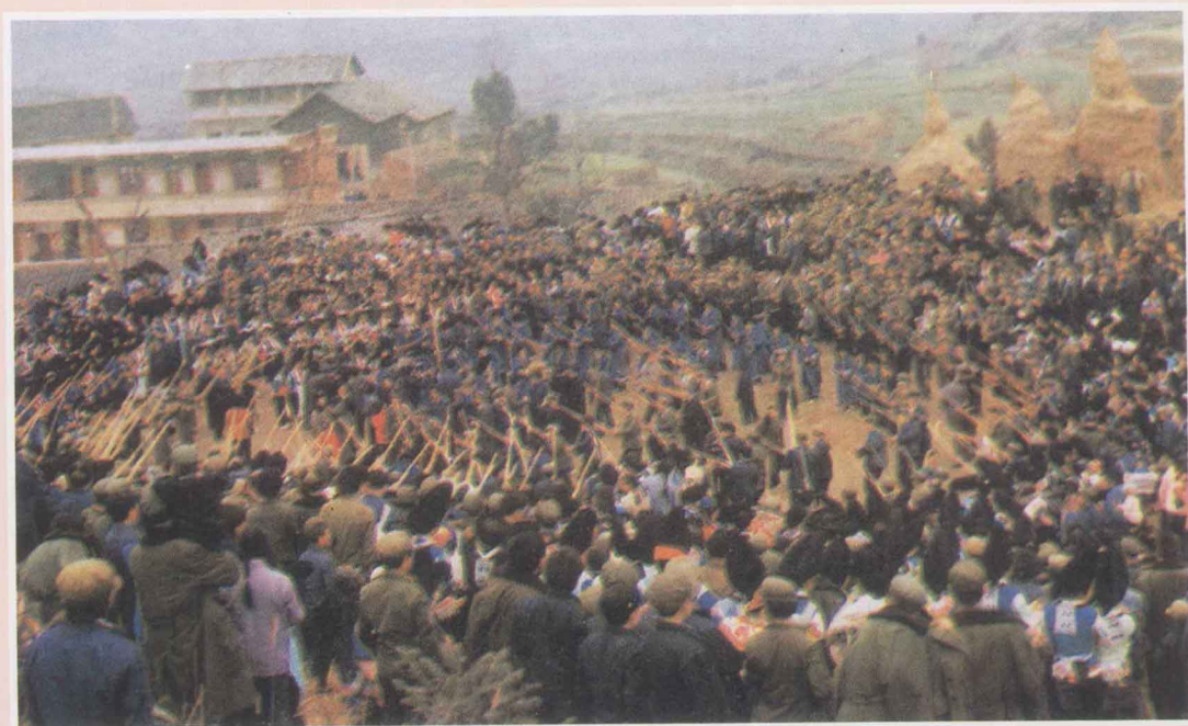
苗族跳洞