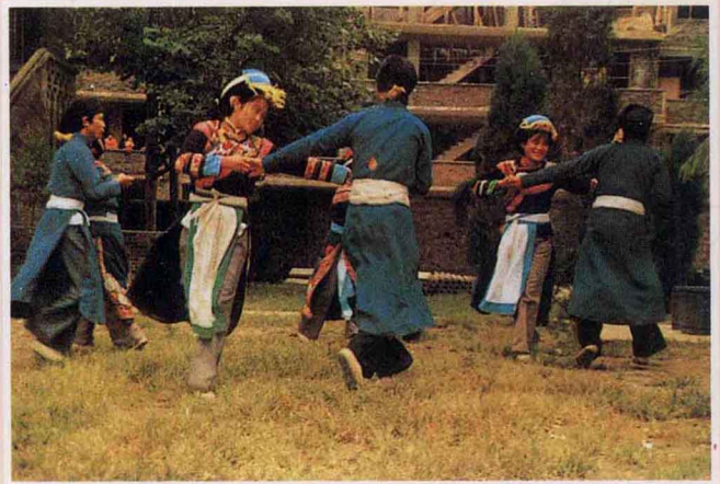
彝族喜鹊钻篱笆