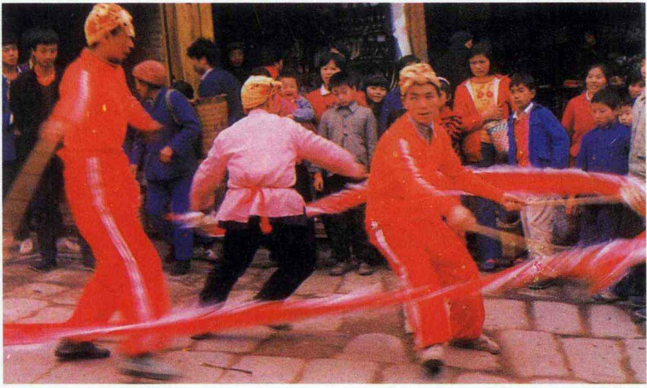
小彩龙舞