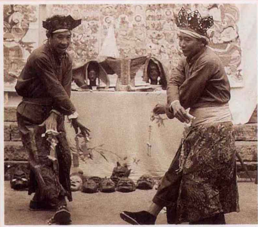
土家族傩舞 德江县文化馆供稿