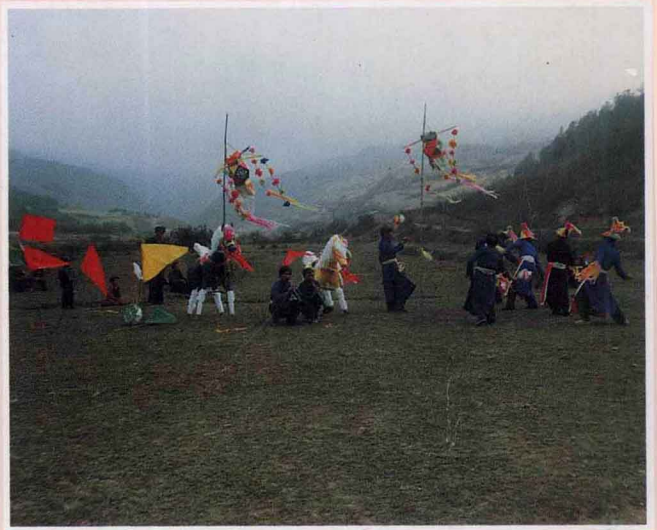
彝族铃铛舞