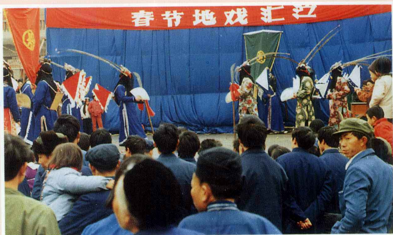
布依族地戏