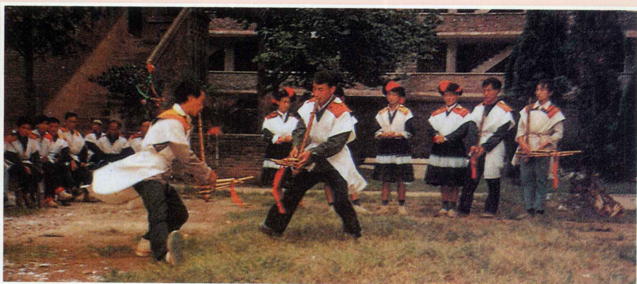
苗族情谊舞