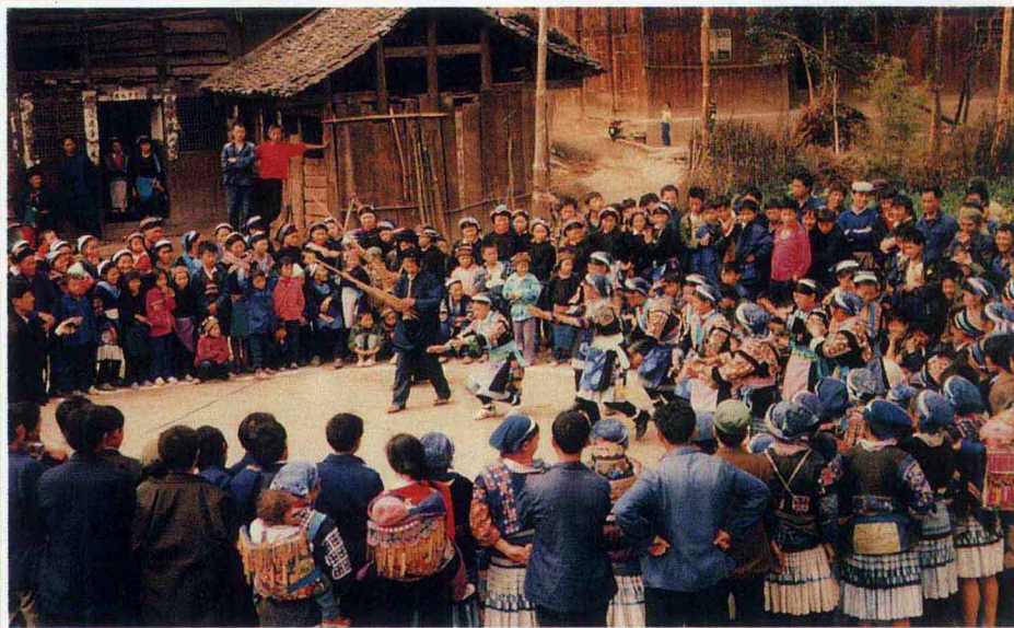
苗族鴉雀舞 龍里縣文化館供稿