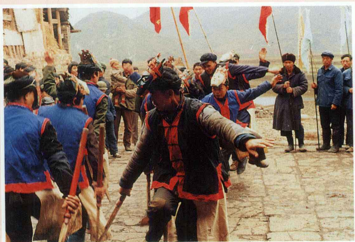
布依族地戏