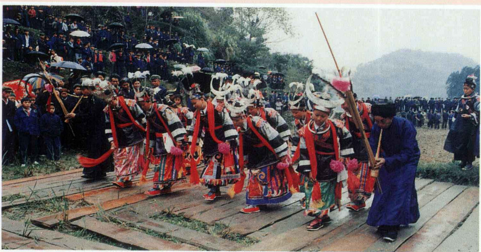
苗族跳月 三都县文化局供稿