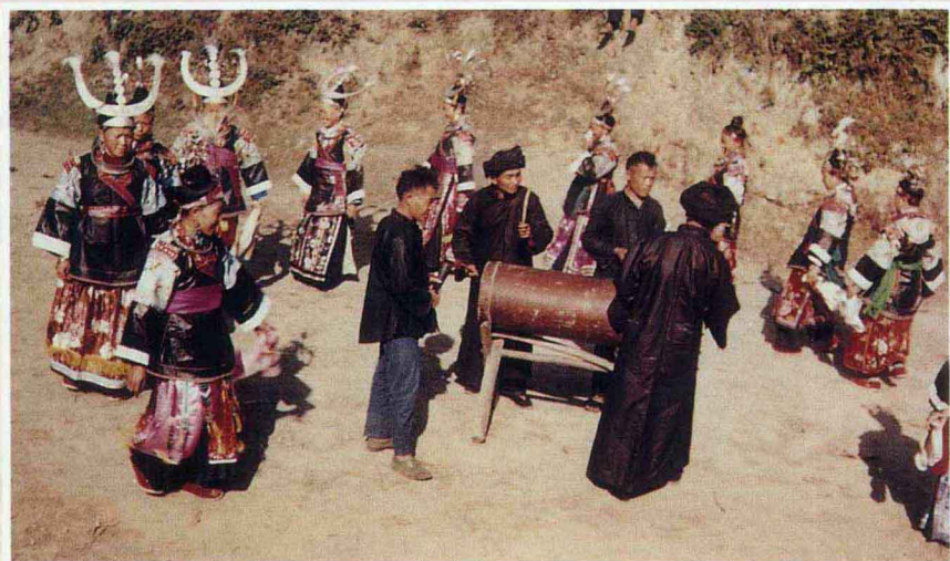
苗族木鼓舞