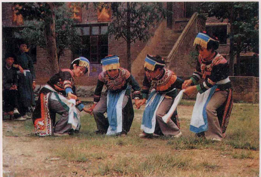
彝族嫁姑娘