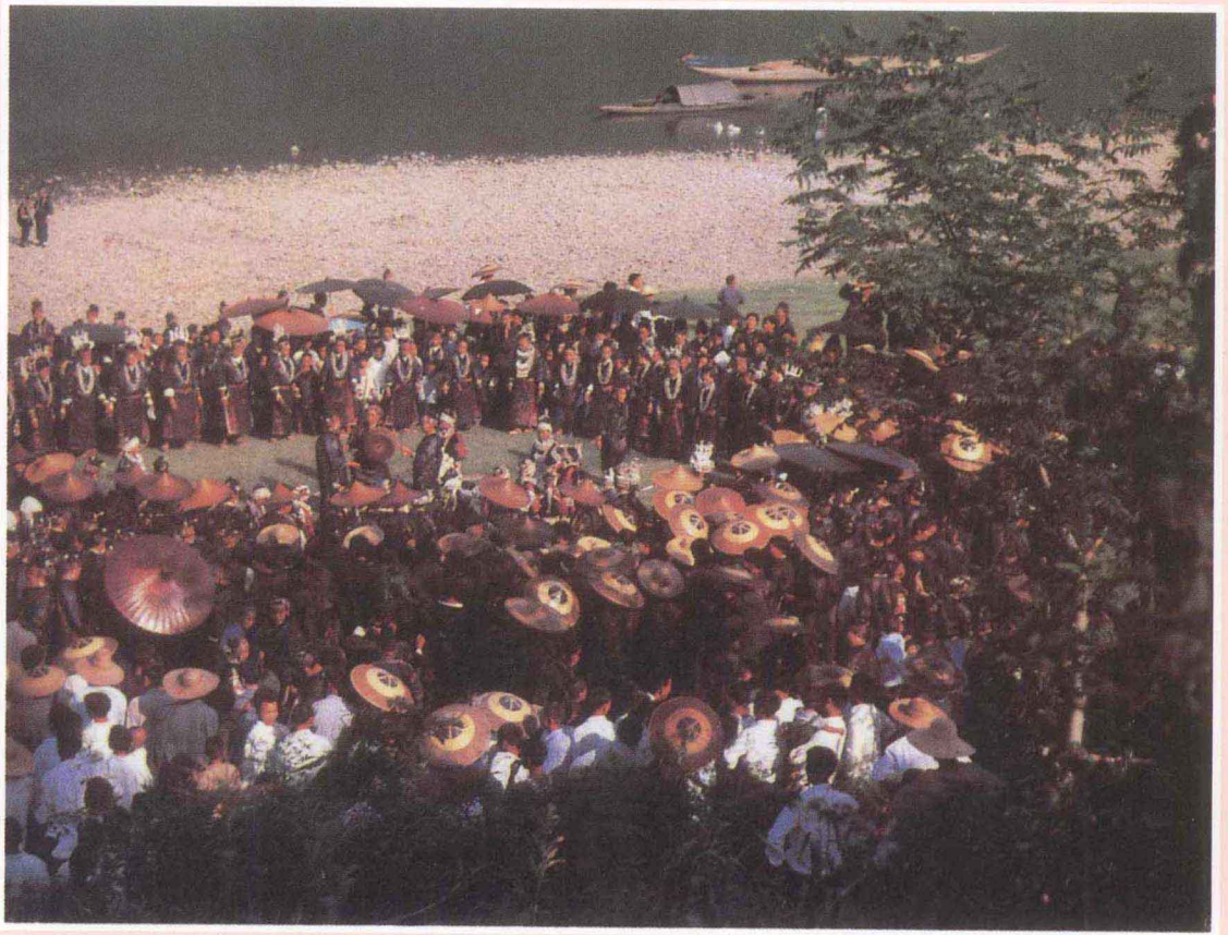
苗族踩鼓 贵州省文化厅《苗装》画册供稿