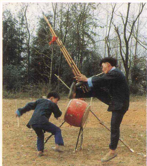
苗族笙鼓舞