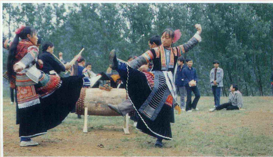
苗族芦笙鼓舞