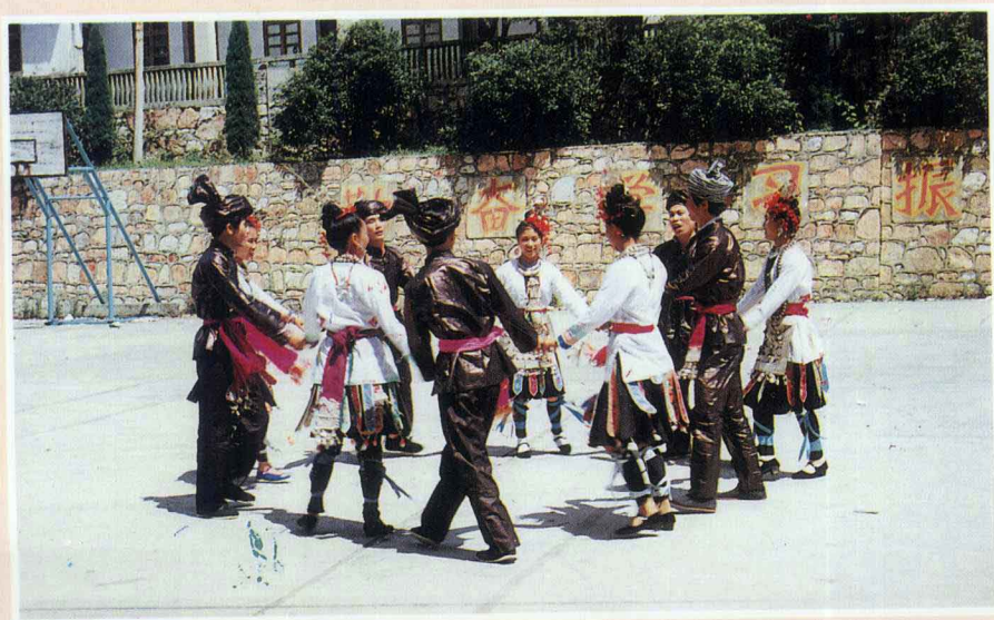
侗族踩歌堂 杨晓辉 摄