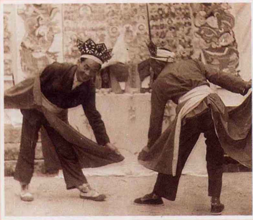
土家族傩舞