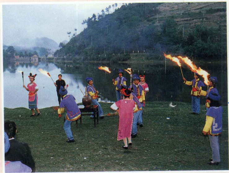
仡佬族踩堂舞