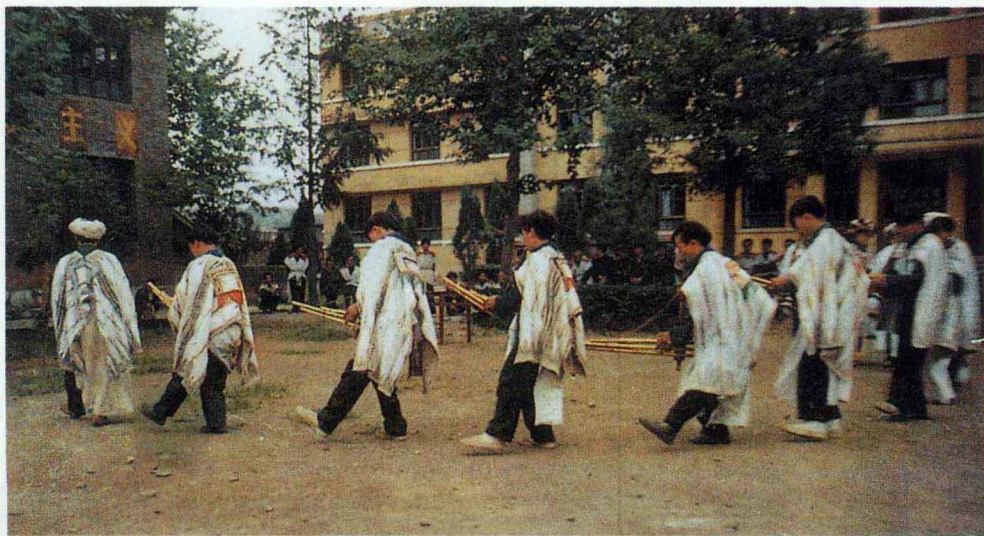
苗族大迁徙舞