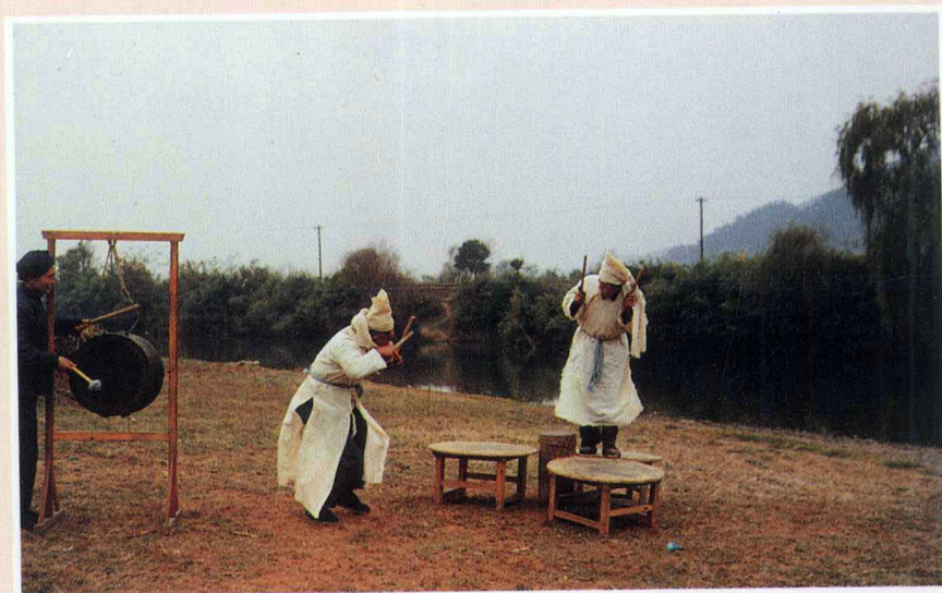
毛南族猴鼓舞