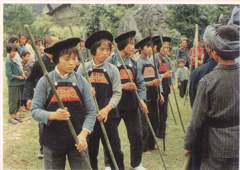
布依族响篙舞