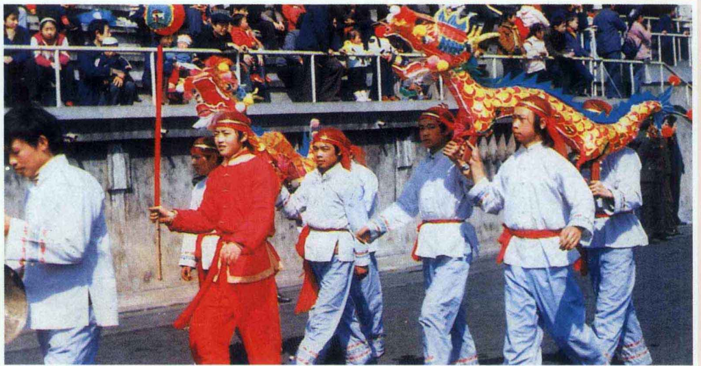
板凳龙 贵阳市文化局供稿