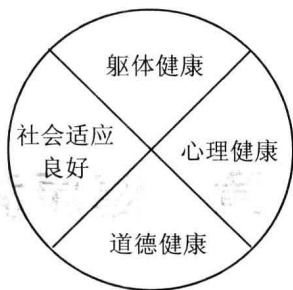
图 1-1 四维健康观

继四维健康观之后，美利坚大学的国家健康中心提出了一个与其类似的健康定义，即健康是人对环境适应后所达到的一种生命质量，个体只有在身体、情绪、智力、精神和社会各方面达到完美状态才称得上真正的健康，这种健康观又称健康五要素，如图 1-2 所示。这种观念将人们对健康的认识提高到一个崭新的高度，并为世界各国学者广泛接受。