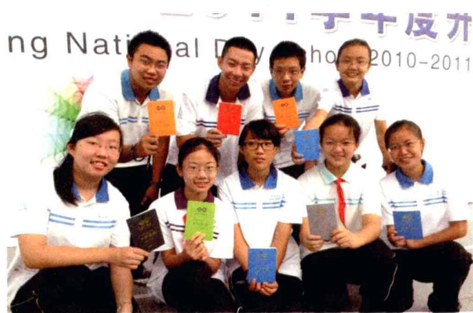
◆ 开学护照 show。

家校互动的热潮；增加了师生相处、交流的机会，增加了学生之间传达感情的机会，增加了家长与孩子之间沟通的机会。