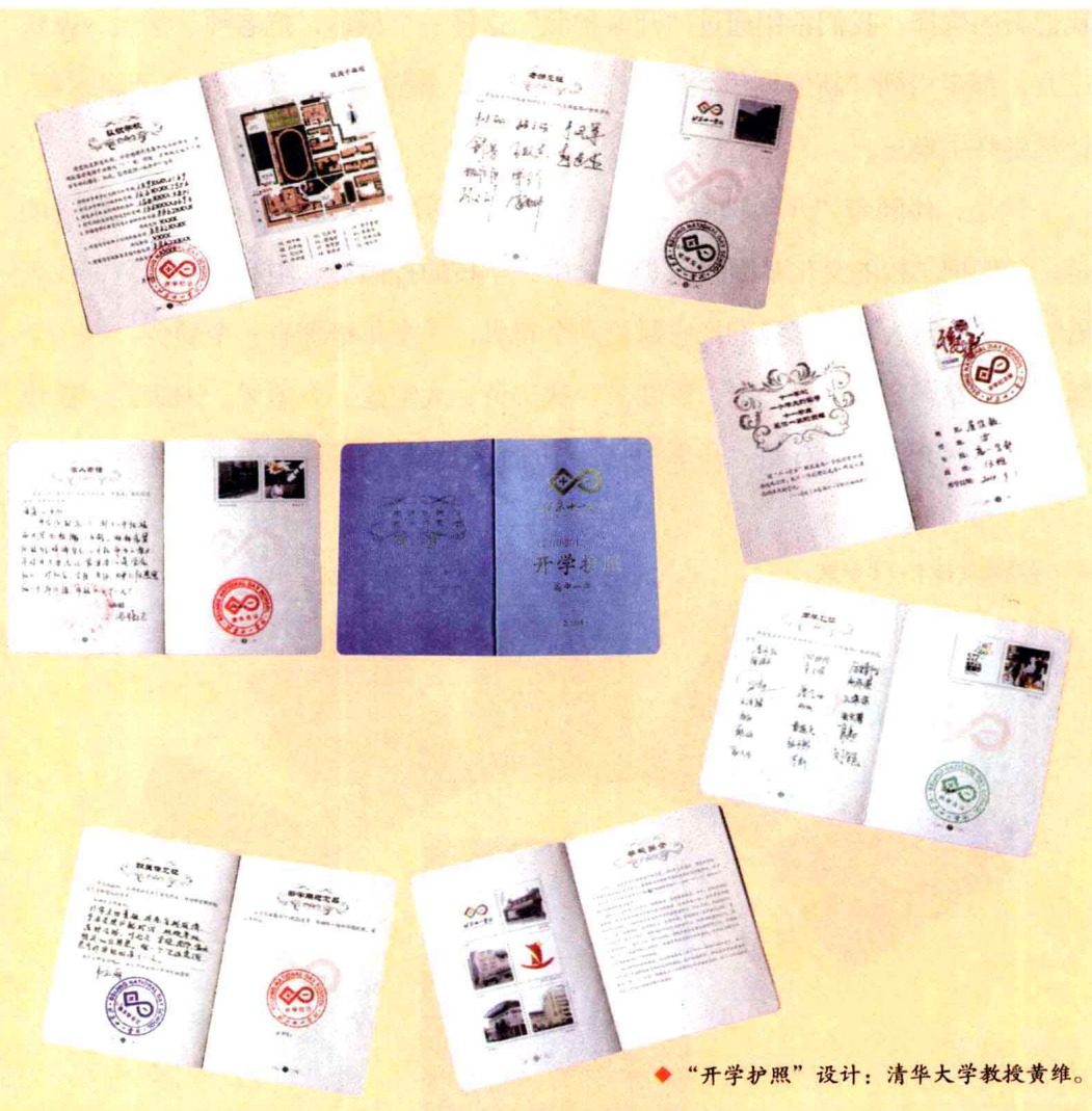
◆“开学护照”设计：清华大学教授黄维。

开学典礼共计 30 分钟，主要有两项活动：首先是通过大屏幕抽取幸运教师，请他们到主席台上给幸运同学颁发护照并签名留念；然后是全体老师为现场所有同学颁发护照并签名。在九月明媚的阳光里，所有人都动起来了，新学期的笑容绽放在每一位师生的脸上。