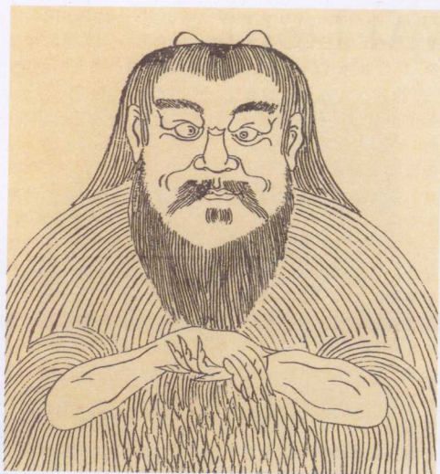
pán gǔ xiàng 盘古像

xiǎo péng yǒu men nǐ men zhī dào tiān dì shì zěn yàng xíng chéng de ma rén 小朋友们，你们知道天地是怎样形成的吗？人 lèi shì cóng nǎ lǐ lái de 类是从哪里来的？