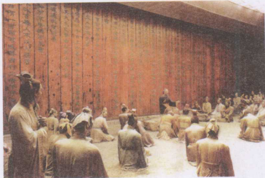
kǒng zǐ jiǎng xué là xiàng 孔子讲学蜡像

jiàn le kǒng zǐ zhuāng chū bù 见了孔子，装出不 gāo xìng de yàng zi shuō nǐ 高兴的样子说：“你 zhè bān nián jì zěn bù míng bai 这般年纪，怎不明白 shì lǐ kǒng zǐ jiàn xiàng tuó 事理。”孔子见项橐 zhè xiǎo hái nián jì xiǎo xiǎo shuō 这小孩年纪小小，说 chū huà lái bù fēn qīng zhòng 出话来不分轻重，