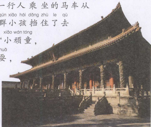
qū fù kǒng miào dà chéng diàn 曲阜孔庙大成殿