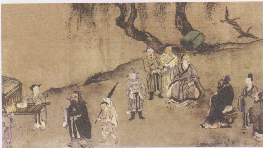
kǒng zǐ shèng jì tú 《孔子圣迹图》

kǒng zǐ cháo dì shàng kàn le kàn shuō dào yuán lái nǐ men lěi de shì yí 孔子朝地上看了看说道：“原来你们垒的是一 zuò xiǎo chéng xiàng tuó liǎng shǒu chà yāo shuō dào jì rán zhī dào shì yí 座小城。”项橐两手叉腰说道：“既然知道是一