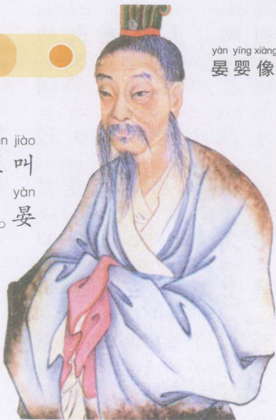
yàn yīng xiàng 晏婴像

chūn qiū shí qī qí guó yǒu gè dà chén jiào 春秋时期，齐国有个大臣叫 yàn yīng rén men dōu zūn chēng tā yàn zǐ yàn 晏婴，人们都尊称他“晏子”。晏 zǐ cái shí chāo rén kǒu ruò xuán hé zài gè 子才识超人，口若悬河，在各 zhū hóu guó zhōng yě hěn yǒu míng qì yīn 诸侯国中也很有名气。因 cǐ dāng shí qí guó de wài jiāo shì wù 此，当时齐国的外交事务 dōu yóu tā zhǔ guǎn 都由他主管。