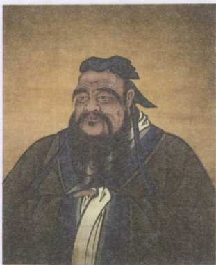
nú jiā xué pài de chuàng shǐ rén 儒家学派的创始人