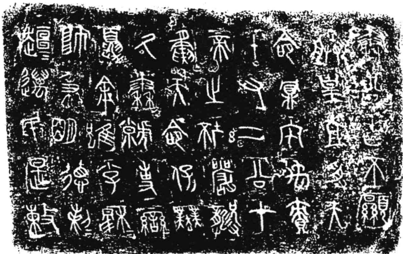
春秋时期的秦国文字