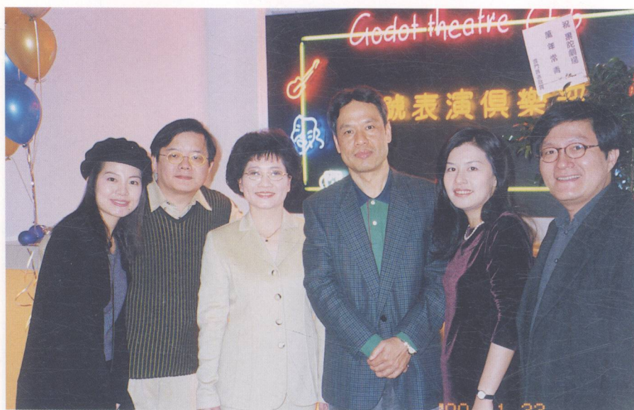
2000年作者（左三）擔任文建會三處處長出席果陀劇場演出