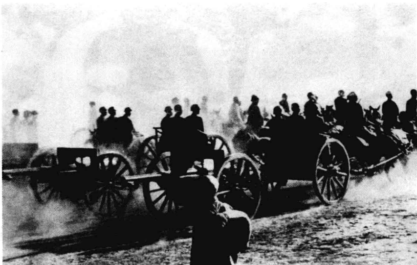
▲ 国民党军队正向战略要地开进途中。