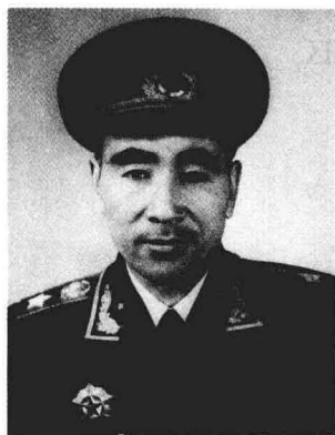
★ 林 彪

东北民主联军总司令林彪，政治委员彭真，副总司令萧劲光、吕正操、周保中，第二参谋长伍修权，第3师师长兼政治委员黄克诚，东北野战军第4纵队司令员吴克华、政治委员莫文骅。