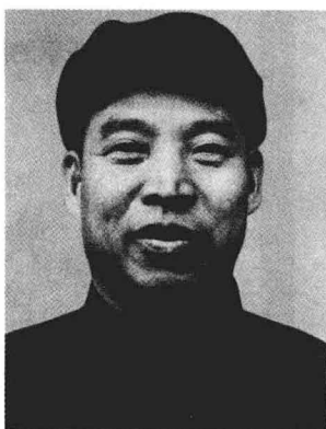
★ 彭 真

1925年入黄埔军校学习并转入中国共产党，曾参加北伐战争、南昌起义、湘南起义，任连长、营长。井冈山斗争时期任团长、纵队司令、红4军军长、红一军团军团长，指挥所部参与历次反“围剿”作战。红军长征后，参与了湘江战役、突破乌江战役，指挥了飞夺泸定桥、攻克腊子口等役。抗战初期，指挥了著名的平型关战斗，后赴苏联养伤。解放战争初期任东北民主联军总司令。1955年被授予元帅军衔。