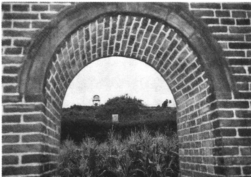
姜嫄墓（陕西武功县1997.9）

姜嫄与帝喾结婚多年没有孩子，这使她感到很遗憾。有一天，她到庙里去求神灵赐给她一个儿子。当她跪拜完毕，抬头看女神时，觉得女神向她点了点头，好像答应了她的请求，于是，她满心欢喜地往回走。她走到一个沼泽的旁边，忽然看到地上有一个很大很大的脚印，她又是惊异，又觉得好玩，便想