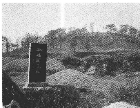
女娲冢遗址(山东枣庄市1997.10)