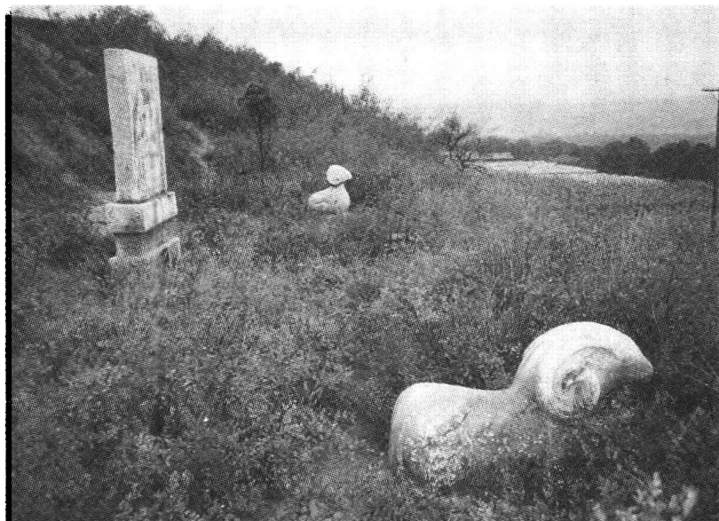
姜嫄墓前石刻(陕西武功县1997.9)

姜嫄墓在陕西省武功县武功镇城边的山坡上，墓高约5米，周长约50米。墓前有石羊1对，再前有砖砌牌楼1座，是清代所建，后毁坏。1993年春重建，牌楼上题刻“姜嫄圣母墓”五个大字。现为省重点文物保护单位。