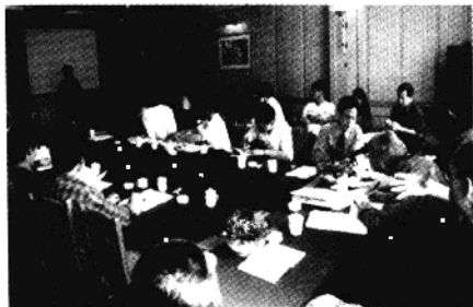
图 1-1 项目研讨会

理”研讨会在云南昆明顺利召开。参加会议的人员约 30 人，分别来自于中国西南地区云南、贵州和四川三省的林业行政管理和理论工作者、社会科学研究者、基层的林业管理工作人员以及来自亚太地区社区林业培训中心的专家和联合国粮农组织社区林业部的官员。根据会前和亚太地区社区林业培训中心的反复讨论（在这个过程中，赵鸭桥先生做了许多具体工作），确定了会议的主要目标是：（一）对冲突理论有了初步的认识和理解，并在此基础上了解国际社会对有关自然资源管理、特别是森林资源冲突管理的研究和应用现状；（二）通过广泛讨论，了解和掌握中国西南地区森林资源管理过程中存在的主要冲突类型，以及政府和社区传统的解决森林资源冲突的办法及其后果；（三）经过广泛讨论，并结合联合国粮农组织社区林业部试图在亚洲及其他洲