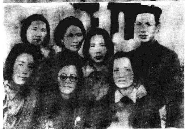
第二保育院 的模范工作者在 山西平定县合影