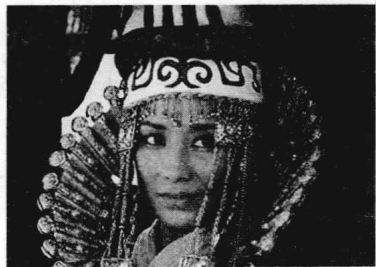
▲ 电视剧《成吉思汗》中的 诃额仑

见这势头,狡猾的泰亦赤兀惕人心生一计,开始向对方喊话:“你们不要再抵抗啦!我们这次来,只是为了你们的