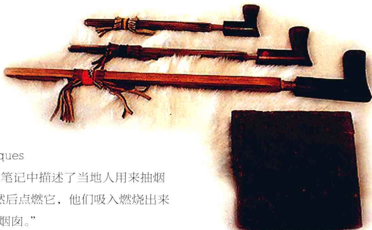
印第安人使用的烟斗

1585年，华特·洛利（Walter Raleigh）将烟草介绍到欧洲，伊丽莎白女王赐封他为骑士。同年，英国有人因吸烟过量而中毒。未几，政府颁布法令，明文规定对吸烟的人给予处罚。