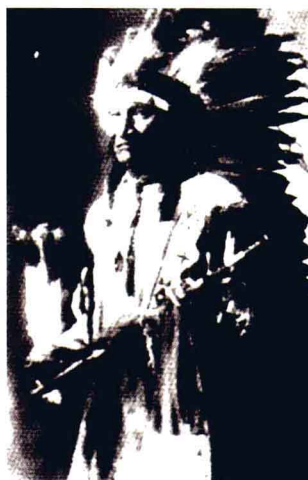
吸烟斗的印第安人