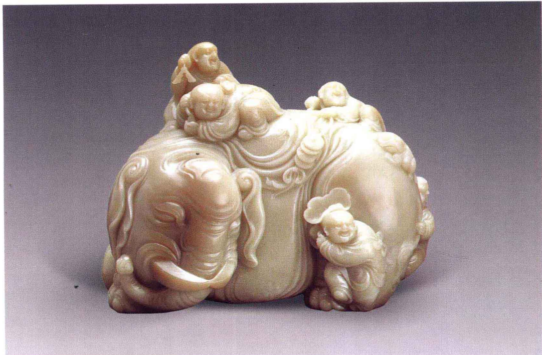
和田玉童子洗象摆件