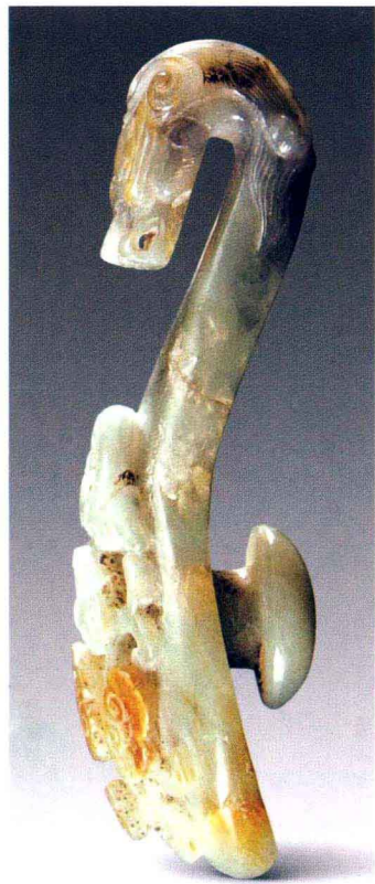
元·青玉龙首螭龙带钩

高 档翡翠非常适合长线投资，近两三年来平均升值30%~50%，有些品相特别出色的翡翠升值更多。目前已经有越来越多的投资者选择收藏翡翠来保值、增值。对翡翠进行主题收藏，收益更大。所谓主题收藏，就是专门收藏某一系列的货品，比如生肖、图腾、宗教或其他具有特别文化内涵的系列藏品。这些藏品单件购买时可能价格不高，但收藏者把它们组成一个系列后，其艺术附加值会明显增加。只要种质好，有特色，交易时价格就会大幅上升。翡翠的价值主要从颜色、质地、透明度、纯净度等方面来衡量。收藏翡翠时要选择纯正天然的正品，要讲究“种”，即翡翠的质地与结构，质地越细腻，玉质就越晶莹剔透；“色”，指颜色，色彩均匀，色正、浓、翠才是上品；“水头”，即透明度，光泽晶莹、通透清澈为上品。其