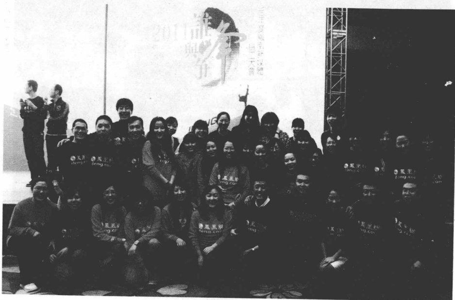
凤凰网职能部门年会合影