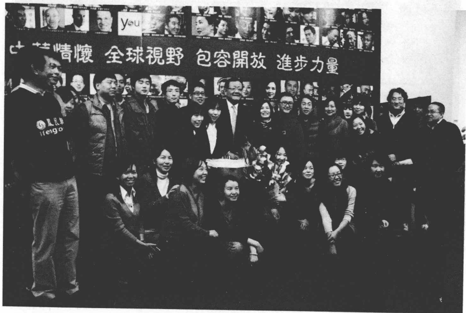
凤凰网员工与刘长乐先生合影