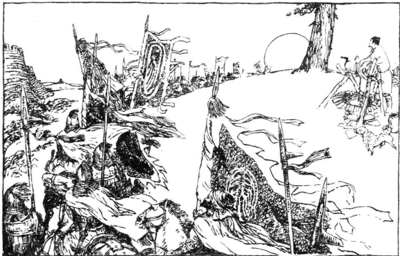
9 解忧公主一行，离别长安，西出阳关，向西城进发。