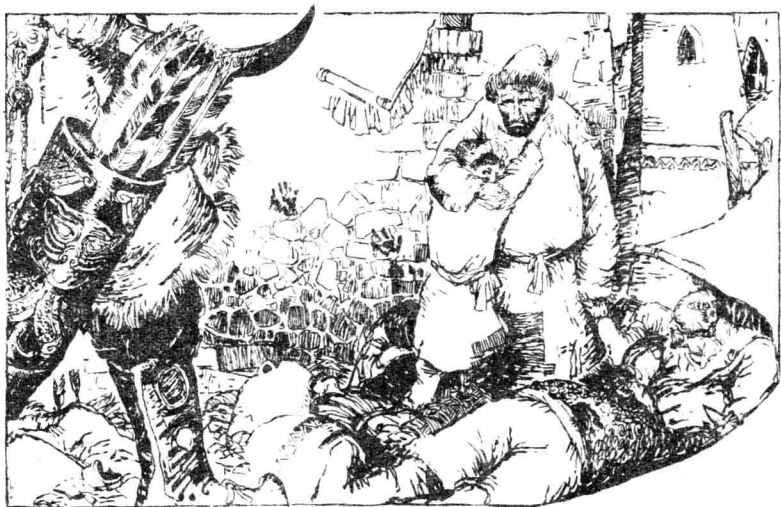
12 龟兹多年受北方匈奴的侵略奴役，百业凋弊，民不聊生。