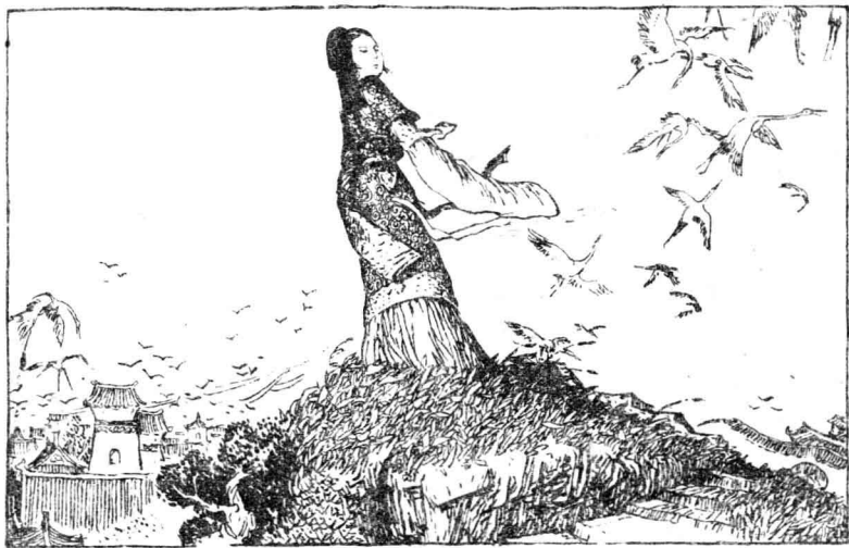
2 汉武帝策封楚王刘戊的孙女解忧为公主，远嫁乌孙。