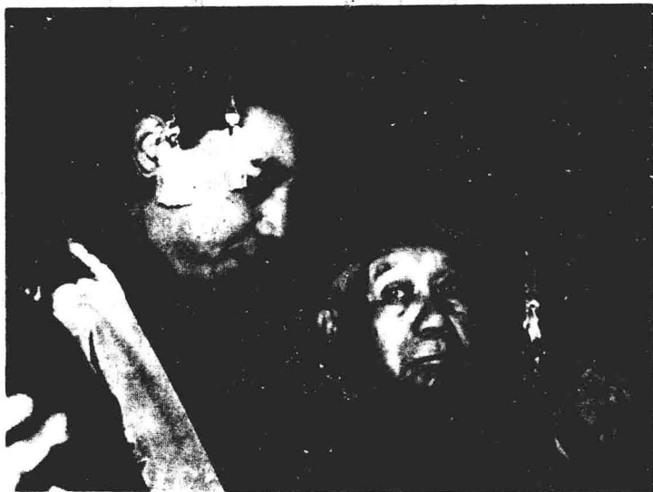
何善衡于1983年获港大颁发名誉法学博士学位。（左为钢琴家傅聪）

善伯最喜欢运动，年轻时喜欢爬山、打网球及游泳，年纪渐长，则改玩运动量没有那么激烈的高尔夫球；每天都到深水湾高尔夫球场打球“松松筋骨”。