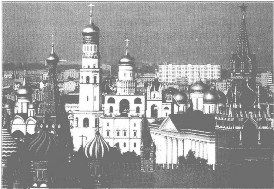
图 1—2 克里姆林宫

1934年夏，共产国际驻上海远东局军事代表弗雷德（又名施特恩）返回莫斯科，9月16日，他向共产国际提交了12条《关于四川—新疆问题的建议》。弗雷德认为：根据几年来斗争的经验，红军的发展极度需要来自国外的援助，而这种援助只能通过加强中共在西北的工作和红军向西北发展的战略来实现。他建议：开始调查通过新疆、外蒙援助的可能性，直接援助陕北的红二十六军，并通过他们接通四川红军。弗雷德还说：我们将来必须要为红军提供武器，包括飞机大炮等等。“需要开始往中亚调运武装西北各省游击队五万名战士所需要的一切。要建立秘密基地仓库，储备能装备50人、100人和1000人的成套备用武器弹药。”“保存这种武器的仓库距离将来使用的地方不要太远。” ①