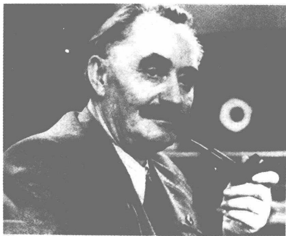
图 1—3 季米特洛夫

踏上了征途，逐渐向西北地区进军。1935年4月，共产国际执委会东方书记处在一份关于中国红军行动的报告称：“今后红军向陕西、甘肃方向发展具有非常远大的前景，因为这些地方的游击队已经建立起一些重要的根据地，并且建立起独立的苏维埃政权。”红军“向西北发展的道路事实上已经打通了” ③ 。后来，苏联国防部、苏联红军情报局与共产国际联络局联合成立了一个三人组，专门研究中国