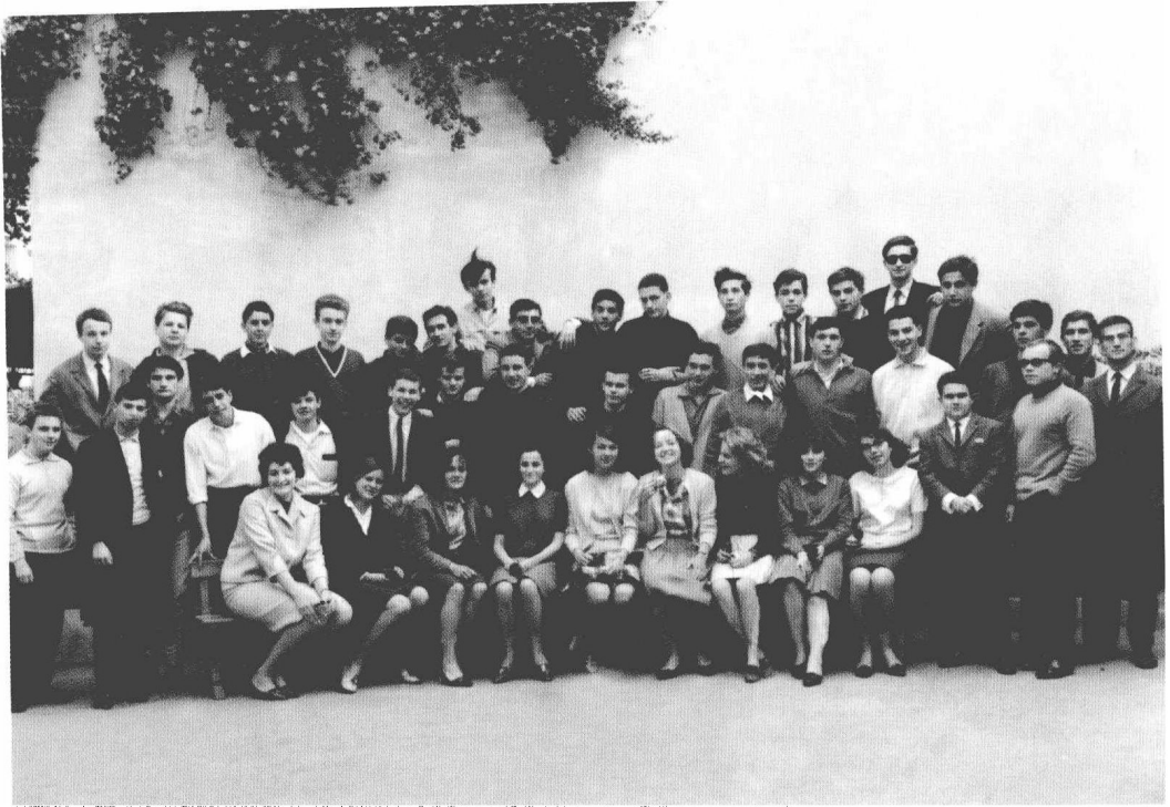
1964—1965 年斯特劳斯-卡恩在摩纳哥上中学时的留影。