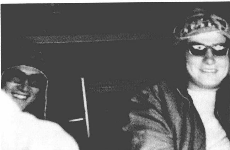
1970 年斯特劳斯-卡恩和他的朋友伊夫·马尼昂在拉丁美洲旅行。