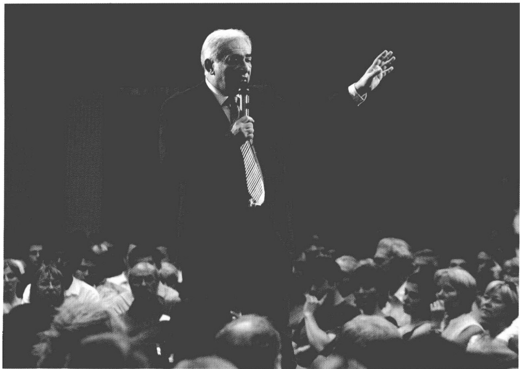
2006 年斯特劳斯-卡恩在巴黎参加社会党初选的竞选活动