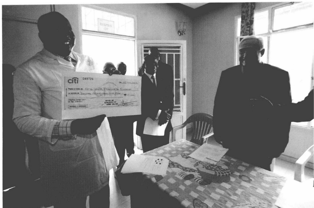
2009 年斯特劳斯-卡恩在金萨沙一个医疗中心里递交国际货币基金组织的募捐