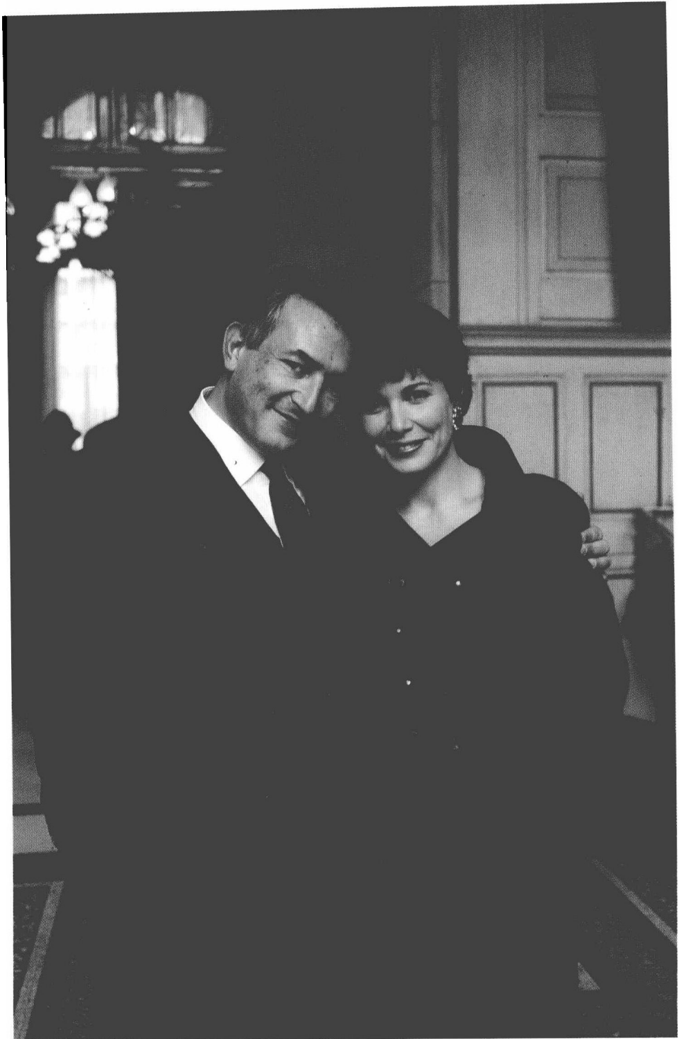
1991年11月26日在巴黎举行婚礼时的斯特劳斯-卡恩和安娜·辛克莱。