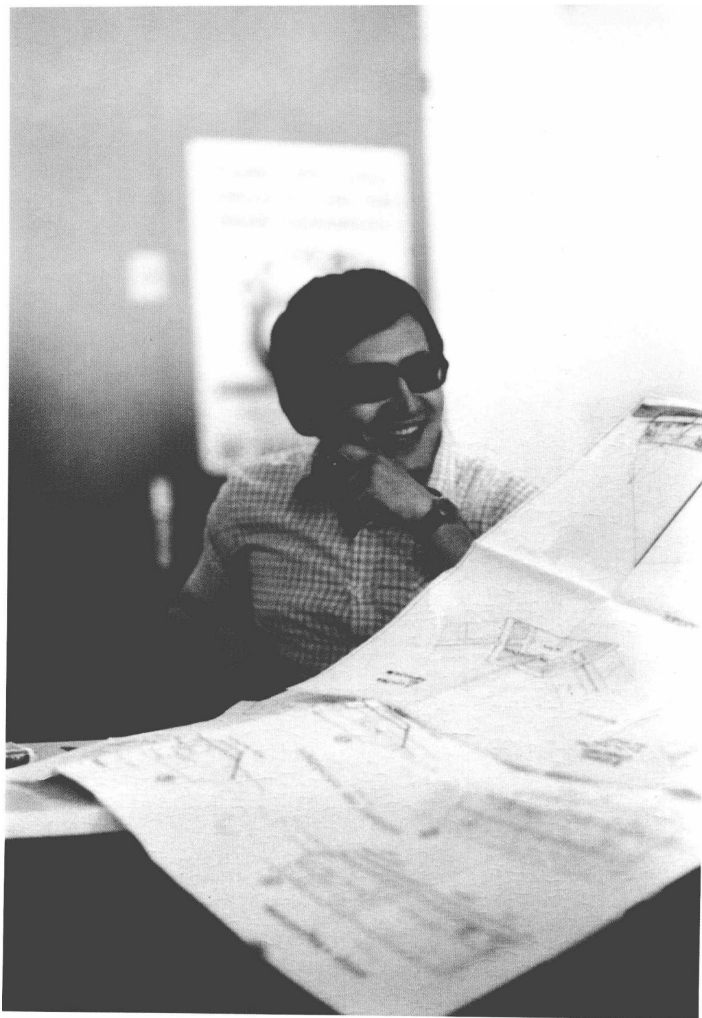
1975 年斯特劳斯-卡恩拿到博士学位时