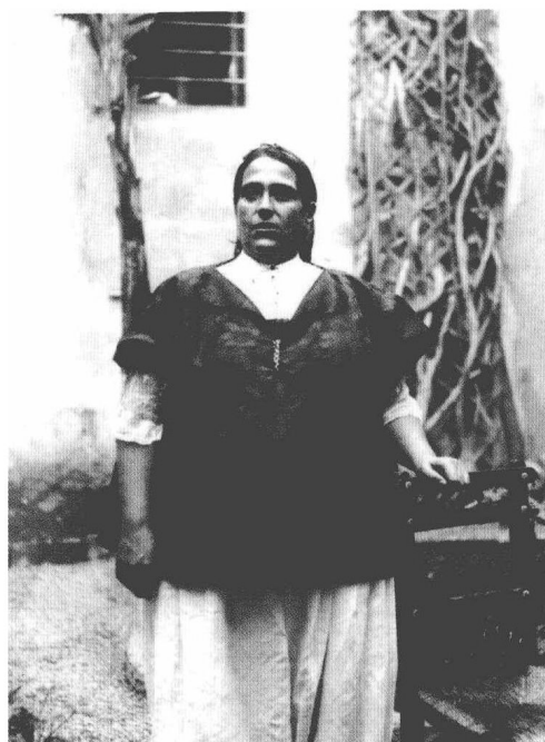
斯特劳斯卡恩突尼斯籍的外曾祖母塔提亚娜·贝尔考夫