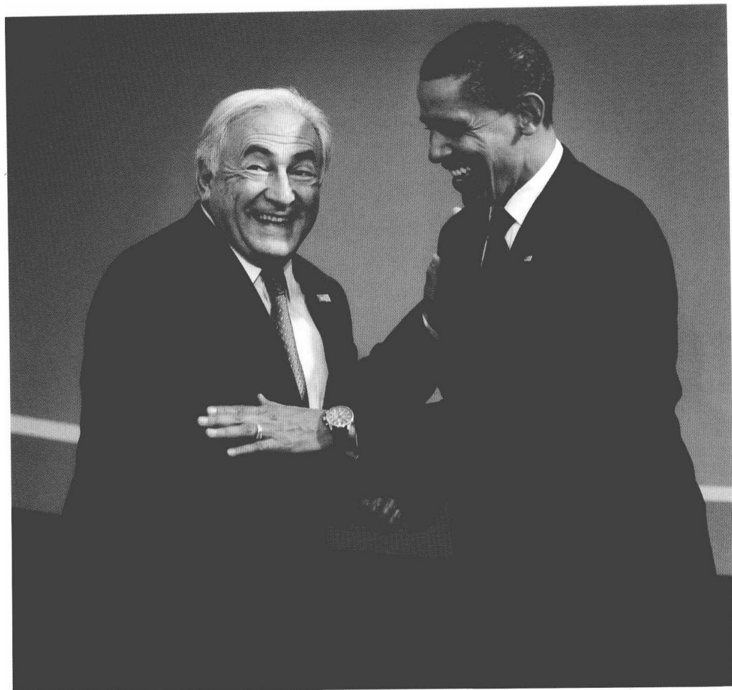
2009年9月斯特劳斯-卡恩在参加匹兹堡峰会时和奥巴马交谈