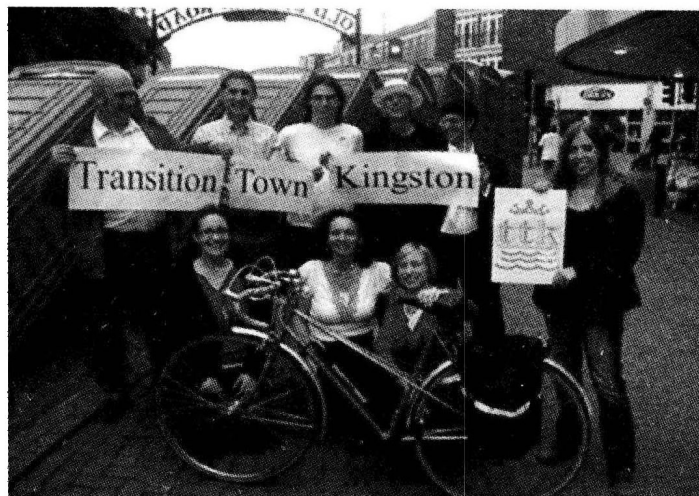
发起金斯顿转型的当地居民（含作者）

我个人关于石油峰值的故事是从2000年开始的。当时我正在约克大学读哲学，出乎意料地收到来自我父亲的一封邮件，信中说“一个关于石油和天然气资源的长期研究显示：在2010年之前，对石油的需求会超出最大可能的供给量，石油价格将会一飞冲天”，并附有一个列出可能结果的大纲。 2