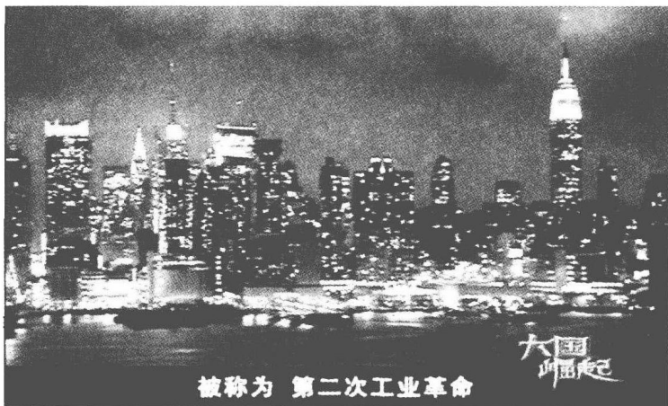
图 1.1 纪录片《大国崛起》——本书写作的一个灵感缘起 ①

《大国崛起》全景式展示了国家兴衰的历史画卷,气势宏大,内容丰富,论说精辟,很快就引起国内外舆论的广泛关注。作为一名电视观众,笔者从头到尾,认认真真看完这部纪录片,深有感怀。中国在历史上曾经有过国运昌盛的时期,如盛唐气象、康乾盛世等,但是在近现代却饱受帝国主义的压迫和侵略,曾被鄙视为“东亚病夫”。对比考察世界各国在这500多年的发展历史,可以看到一个一个国家崛起的身影,以及背后推动的力量,这里面有许多值得世人思考、学者研究的问题。何为世界性大国?大国如何崛起?崛起后又如何?这里面的历史经验对中国的今天有何启迪?面向历史兴衰的诸多发问,可以说触动了上至党和国家领导人,下自平民百姓、芸芸受众的关注和思考。