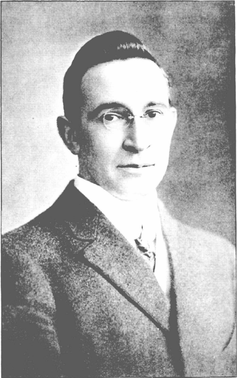
B. C. FORBES