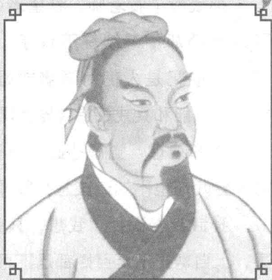
孙武，春秋时期齐国人，字长卿，因其所著《兵法十三篇》被誉为百世兵家之师、东方兵学之鼻祖。

孙武在战乱期间曾将自己所著《兵法十三篇》敬献给吴王阖闾，吴王当即授命孙武为战前将领。孙武每每出兵打仗，都是战无不胜，攻无不克。《史记》中记载孙武曾与伍子胥一起率领六万精兵打败了楚国二十万大军，成功攻入楚国郢都，北威齐晋，南服越人，显名诸侯。孙武所著的《兵法十三篇》是我国至今发现最早的兵法，也被誉为“兵学圣典”，置于《武经七书》之首，后来享誉国际，被翻译成各种文字流传于世界各地，也成为世界上最著名的兵学典范之书。