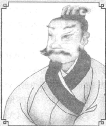
伍子胥，名员(yuán)，字子胥，春秋时期楚国人，吴国大夫，杰出的政治家、军事家。

在孙武和伍子胥的辅佐下，吴国的霸业蒸蒸日上，吴王夫差渐渐地松懈下来，也不再像以前那样励精图治，反而重用奸臣伯嚭。而此时的越王勾践为了雪耻灭吴，自己不仅卧薪尝胆，还用美人计来诱惑夫差。一味沉迷于酒色的夫差开始听信谗言，劳民伤财地大兴土木，伍子胥一再进谏，夫差根本听不进去，最后逼得伍子胥自尽。夫差不但不安葬伍子胥，还命人把他的尸体装进皮袋丢进了江里。